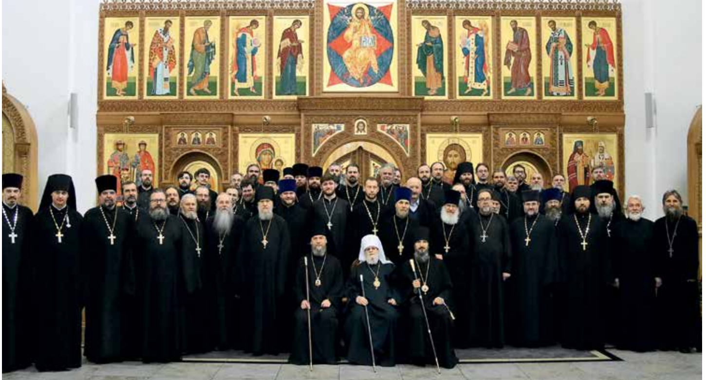
Делегаты Поместного Собора Эстонской Православной Церкви. 2017 г.

дают от политиков, которые так или иначе хотят использовать авторитет Православной Церкви.