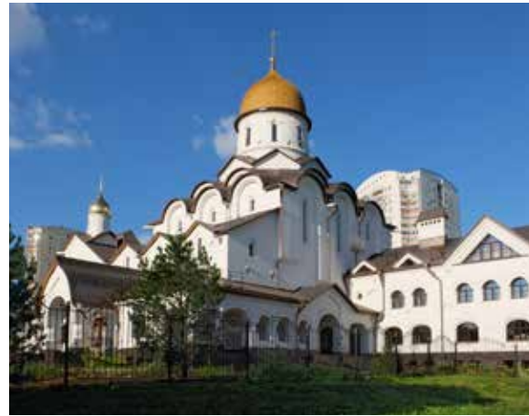
Храм преподобного Серафима Саровского в Раеве