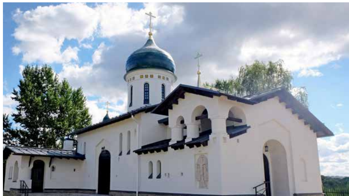
Храм преподобного Серафима Саровского в Кожухове