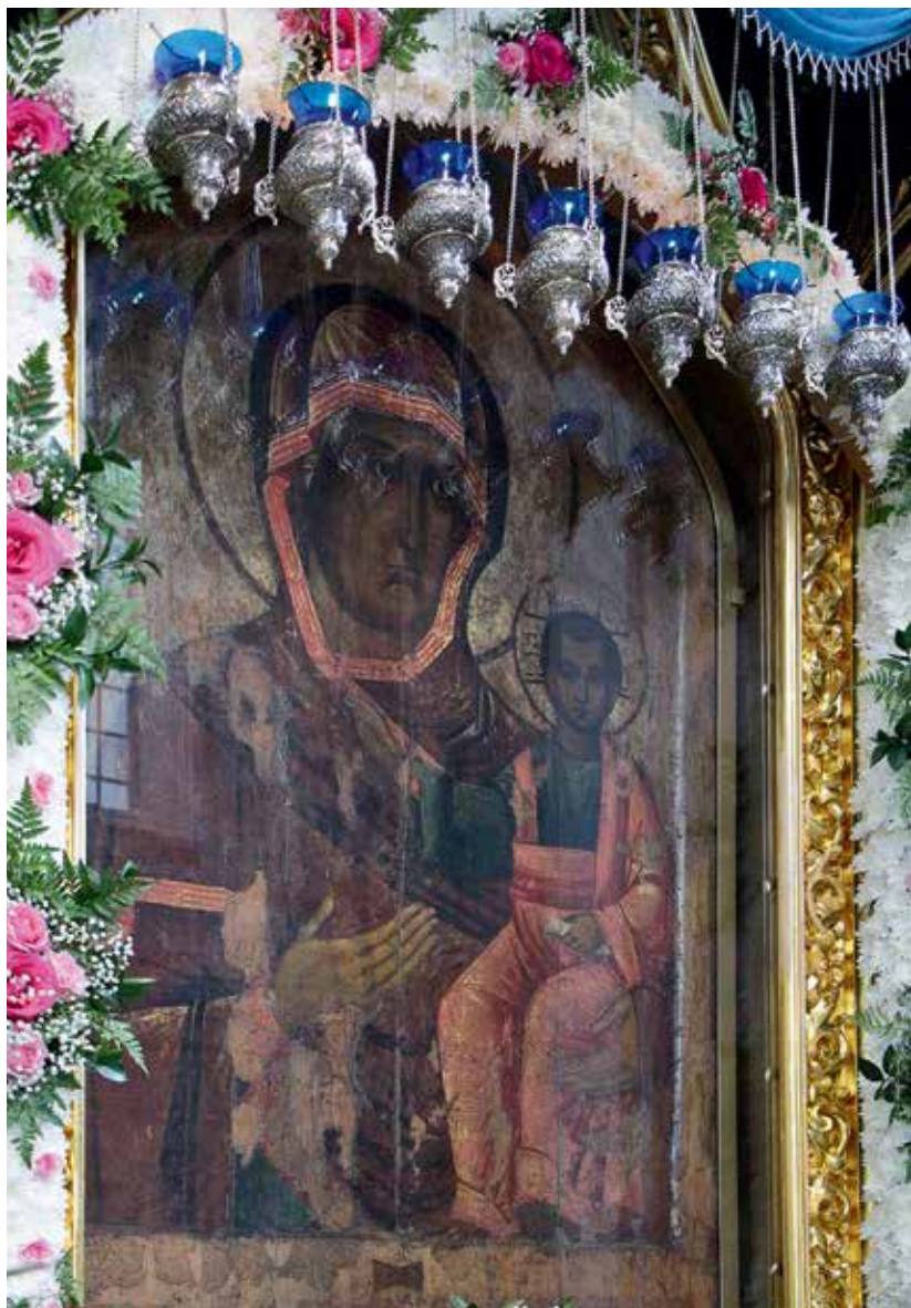
Икона Божией Матери «Одигитрия» — покровительница Смоленской земли находится в Свято-Успенском кафедральном соборе

тельно разобраться в той или иной ситуации. Если это недопонимание усугубляется и разрыв становится ощутимым, то Святейший Патриарх может поручить мне как главе митрополии самому урегулировать спорный вопрос и доложить ему суть дела. Слава Богу, таких случаев за три года у нас не было.