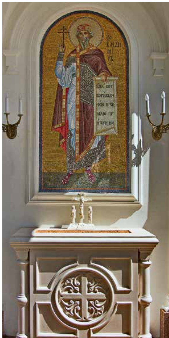
Мозаика в часовне

Отдельное направление деятельности воскресной школы — создание мультфильмов на основе детских рисунков. Уже вышли мультипликационные истории: «Житие преподобного Сергия глазами детей» и две серии «Евангельских притч». Текст озвучивали учащиеся воскресной школы. Участие в создании мультфильмов помогает им лучше узнать основы православной веры, научиться более уверенно говорить на русском, которым многие из них, родившиеся в смешанных семьях, уже не владеют столь свободно.