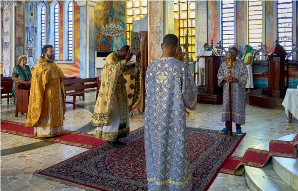
Богослужение в кафедральном соборе г. Мапуту. Мозамбик

В храме Преподобного Сергия Радонежского собираются люди не только для участия в церковных Таинствах, но и для того, чтобы разделить радость общения на родном языке, приобщить детей к русскому языку и культуре.