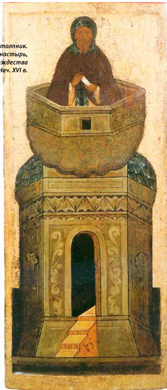
Святой Даниил Столпник. Ферапонтов монастырь, иконостас собора Рождества Богородицы. Нач. XVI в.

или его посланцы, либо он сам посылал к императору. С особой силой политический авторитет преподобного Даниила проявился в 476 году, когда император Зинон был свергнут своим родственником Василиском, симпатизировавшим монофизитам. Тяжелобольной подвижник, не способный ходить из-за язв на ногах от долгого стояния, впервые за много лет спускается со своего столпа и отправляется с толпой через весь город, чтобы поддержать православную позицию Патриарха Акакия.