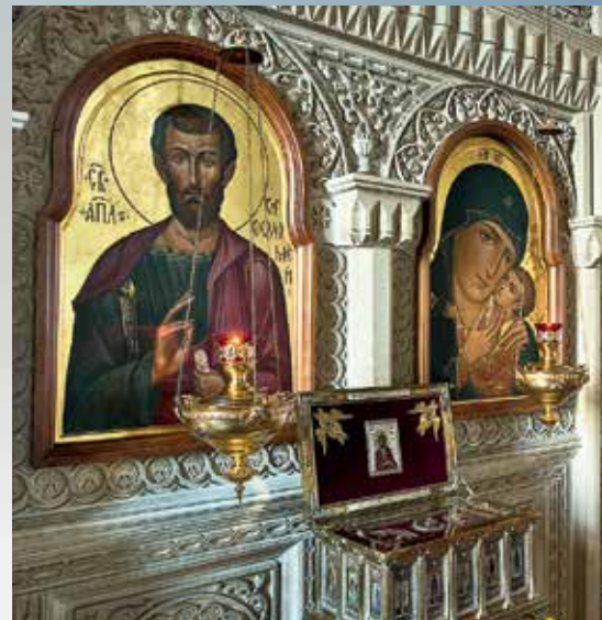
Иконостас кафедрального собора свв. Жен-Мироносиц и ковчег с частицей мощей святого апостола Варфоломея