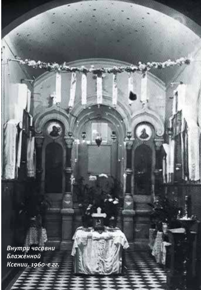
Внутри часовни Блаженной Ксении. 1960-е гг.