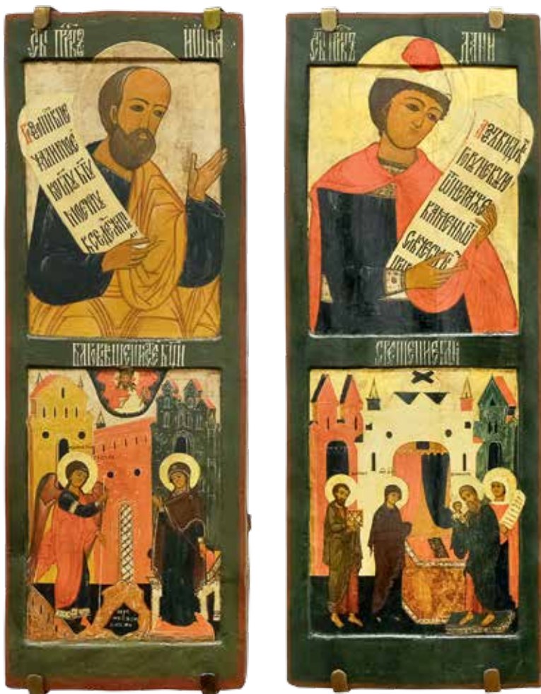
Деисусный и праздничный чины: пророк Иона, Благовещение; пророк Даниил, Сретение. Последняя треть XVII в. Из Богоявленской церкви с. Ошевенское