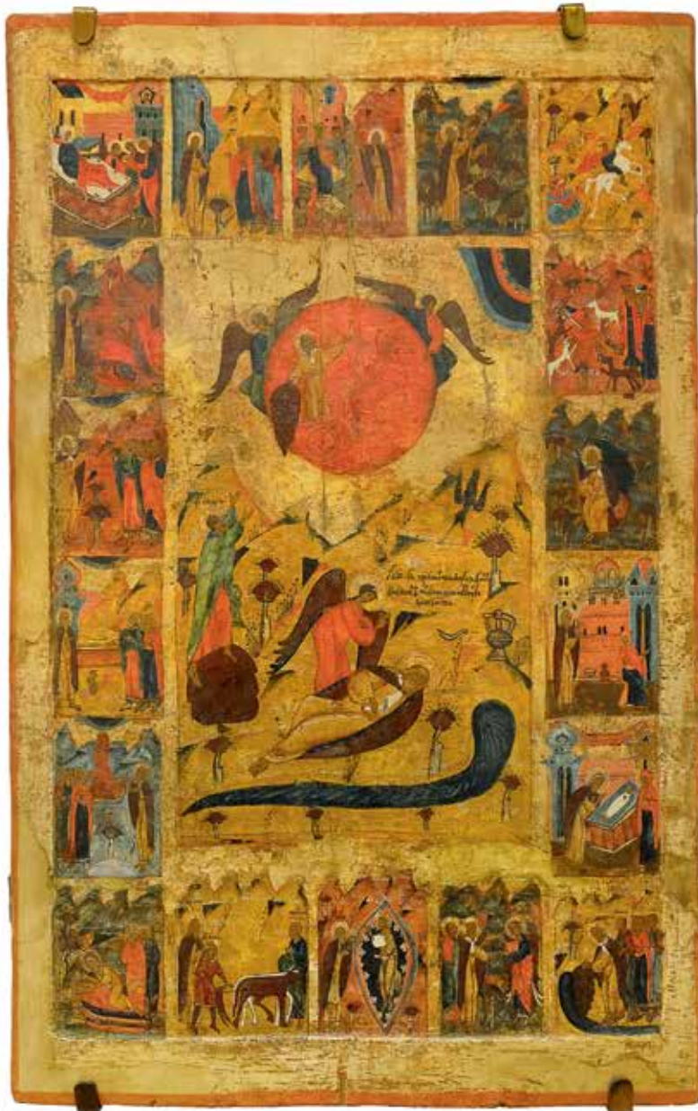
Огненное восхождение пророка Илии с житием. Кон. XVI — нач. XVII в. Из Ильинской церкви с. Задняя Дубрава

в каргопольском наследии. Ее принял, благословив распространение по Русскому Северу таких объемных икон, митрополит Новгородский Макарий, впоследствии прославленный Церковью в святительском лике. Возможно, благодаря этому подобное своеобычное проявление северного христианского искусства дошло до нас в более-менее значимых объемах. Из памятников этого ряда на выставке демонстрируется также «Христос в темнице» из церкви на Куфтыревском погосте (конец XVIII — начало XIX века). «Конечно, в храмовом пространстве такой объемный образ обычно помещался в глубокий киот, и молящиеся видели его лишь частично, и то в полумраке», — замечает Татьяна Кольцова.