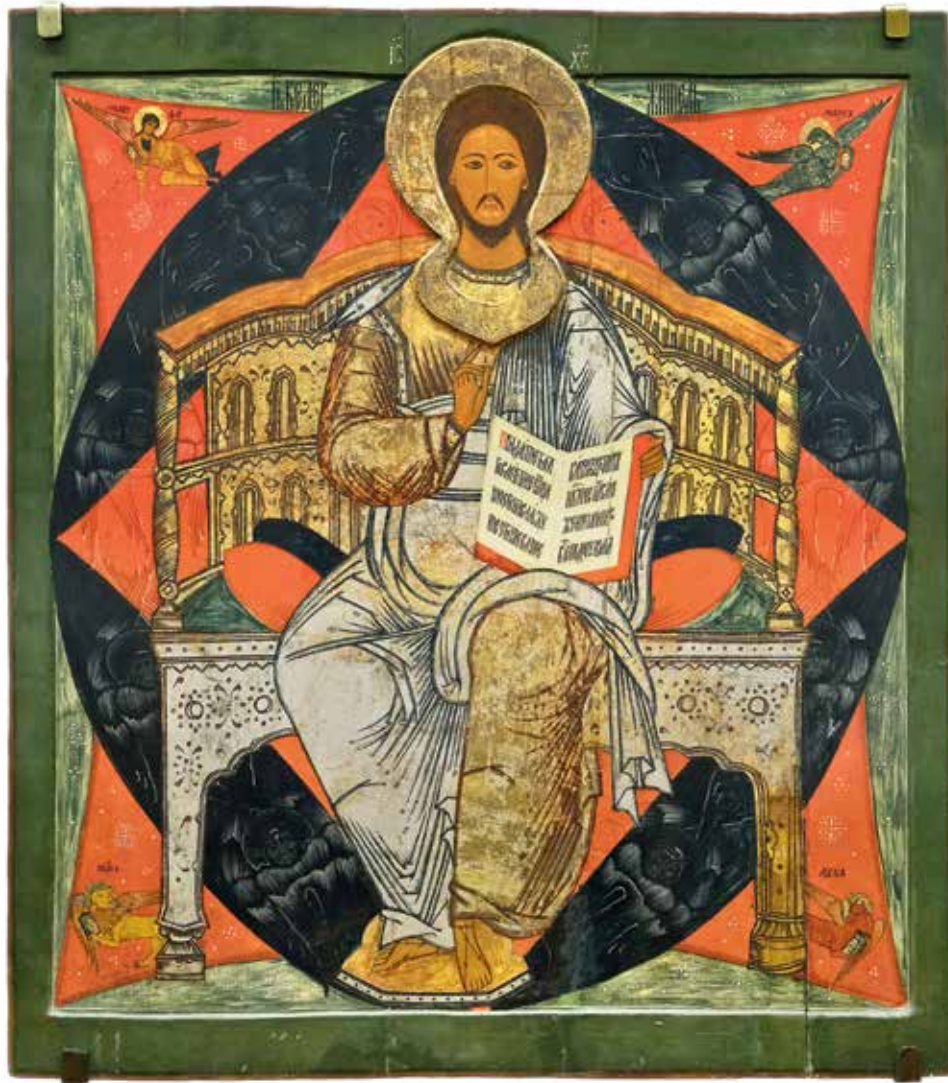
Спас в силах из Деисусного чина. Последняя треть XVII в. Из Богоявленской церкви с. Ошевенское

стало очевидно: надо забирать все, что можно, иначе иконы исчезнут безвозвратно. В экспозиции можно увидеть датирующийся рубежом XV–XVI столетий Деисусный чин из Никольской церкви в селе Астафьево. Сначала она осела, потом упала, потом ее... разобрали на дрова. Рядом — еще один Деисусный чин (Богоматерь и Иоанн Предтеча) из сложенной в 1665 году деревянной церкви Иоанна Златоуста в селе Саунино. Выставленная здесь же рама с житийными клеймами от образа святителя Николая располагалась в местном чине иконостаса. «Музей намеревался сохранить весь иконостас как исторический комплекс — ведь в нем ценны не только иконы, но и каркас, и резные деревянные детали, и общее восприятие памятника, — говорит Кольцова. — Увы, в итоге не удалось вывезти даже иконы всех ярусов: очередная экспедиция констатировала их гибель. Посмотрите на ико-