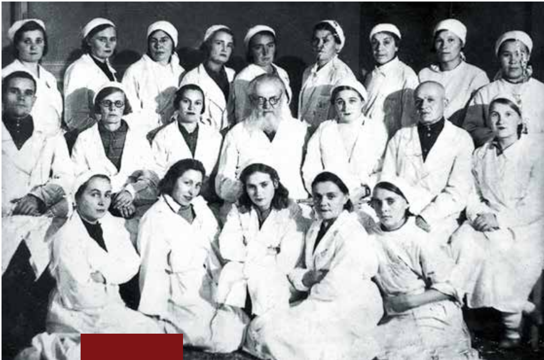
Архиепископ Лука Войно- Ясенецкий с медперсоналом госпиталя

очень разного содержания и интеллектуального качества, далеко не всегда благочестивого или хотя бы безобидного свойства. И поэтому вопрос зачастую упирается не в обязанности сами по себе, а в сферу их исполнения.