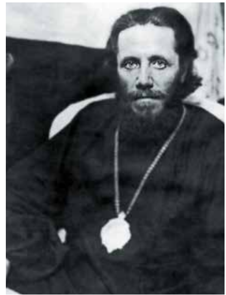
Слева направо: сщмч. митр. Петроградский Вениамин; сщмч. Лев (Егоров). 1920 г.; еп. Иннокентий (Тихонов). 1925 г.

объединиться в церковные союзы. В этот день руководителем братства единогласно избрали протоиерея Романа Медведя, был принят Устав и обязательство поступающего в братство.