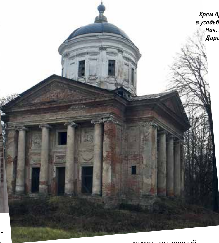
Храм Архангела Михаила в усадьбе Барышниковых. Нач. XIX в. С. Алексино, Дорогобужский район

— Да, есть некоторые трудности с возвращением церковных богослужебных предметов, изъятых у Церкви в 1922 году. Это облачения, потиры, диски, лжицы, мощевики и др. Это порядка 277 предметов. Они хранятся в нашем Смоленском краеведческом музее-заповеднике и в его фондах. Было больше, но часть разграбили немецкие оккупанты во время Великой Отечественной войны. До сих пор неизвестно, например, где икона Смоленской Богоматери, которая была написана, по преданию, евангелистом Лукой и находилась в соборе на