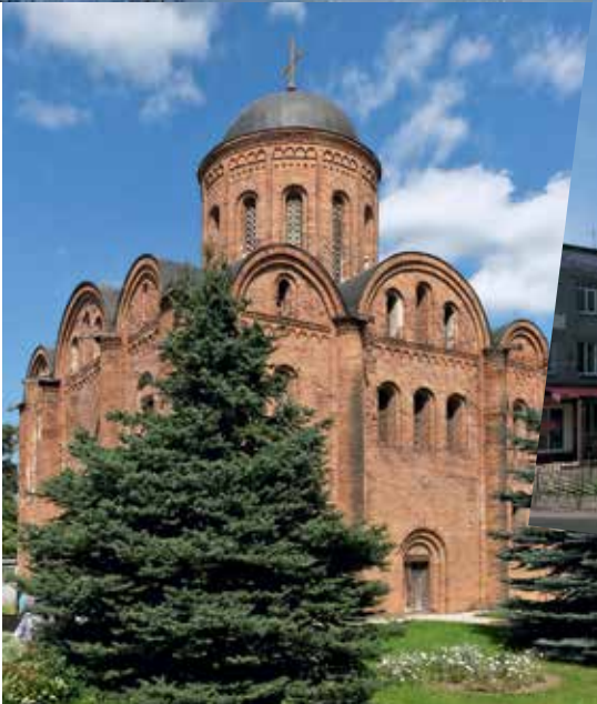
Храм Свв. апп. Петра и Павла. XII в. Смоленск