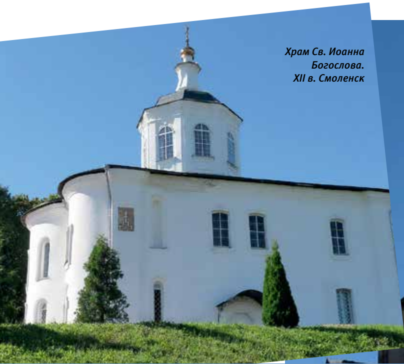
Храм Св. Иоанна Богослова. XII в. Смоленск