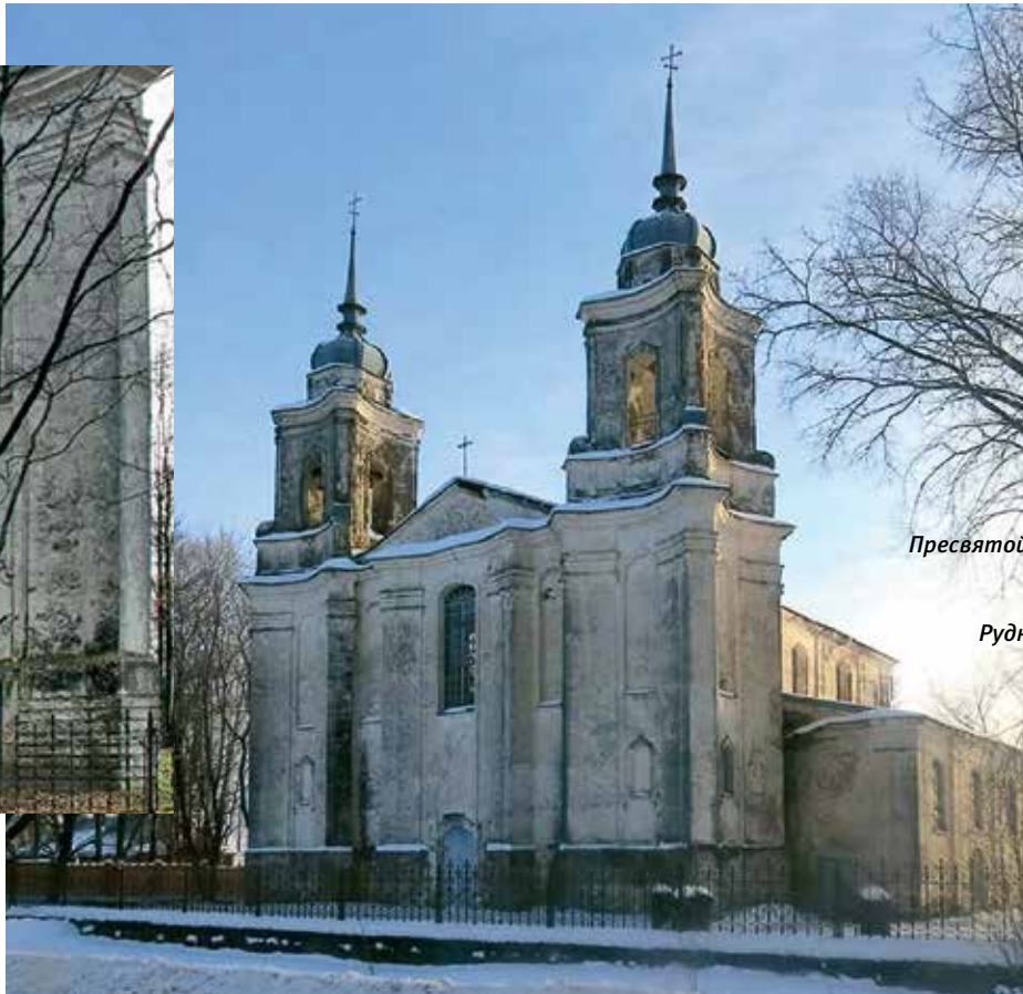
Храм Успения Пресвятой Богородицы. Сер. XVIII в. С. Любавичи, Руднянский район