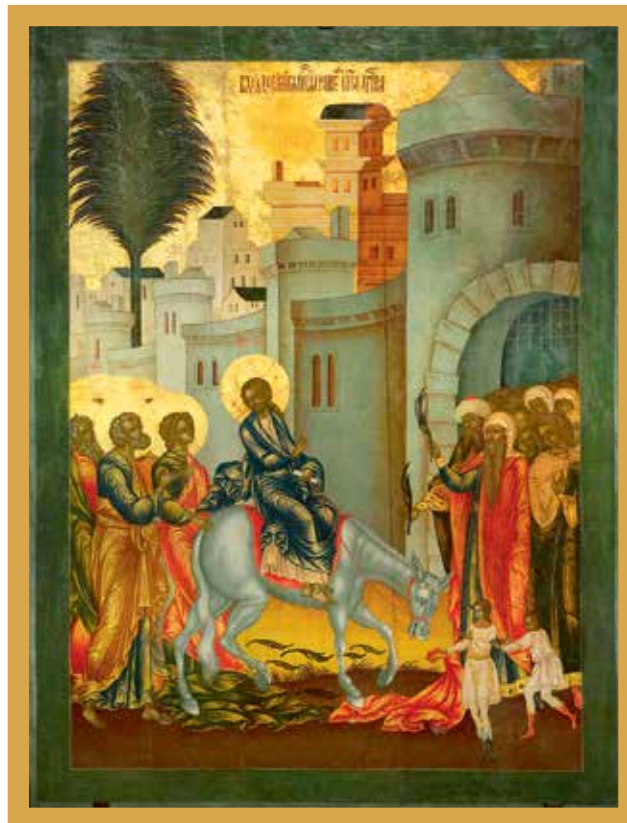
Вход Господень в Иерусалим. Конец XVIII в. Дерево, темпера. Реставратор Д. Лосева (2018)