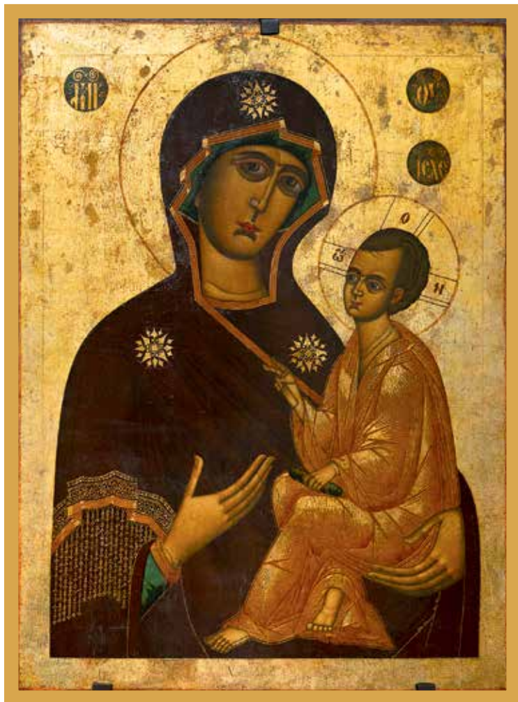
Тихвинская икона Божией Матери. 1744 г. Дерево, темпера. Из церкви Параскевы Пятницы в Калачной слободе Реставратор Т. Шабанова (2003)