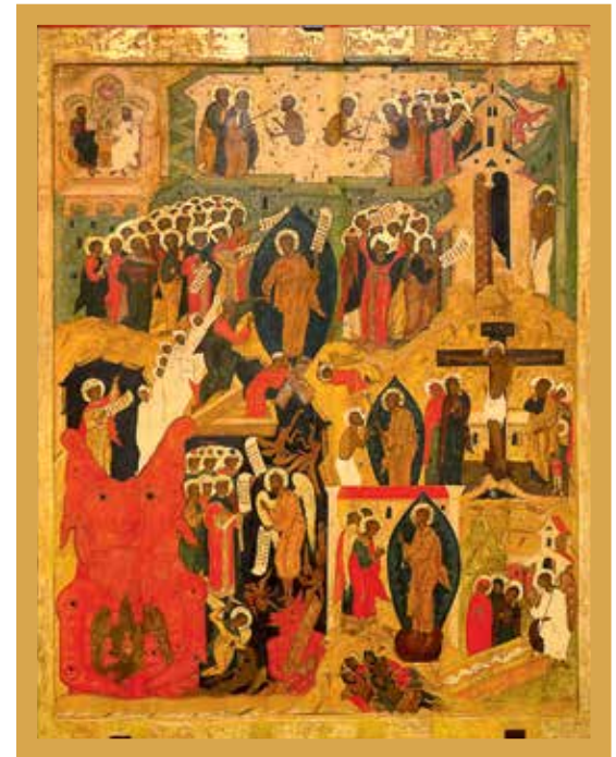
Воскресение — Сошествие во ад. Вторая пол. XVI в. Дерево, темпера. Реставратор А. Клячина (2008)

О трехвековом временном разбросе иконописных творений и говорить нечего. Впрочем, обычному, среднему посетителю, не обремененному профессиональными познаниями, это, наоборот, только добавляет интереса. Когда еще подобное увидишь!