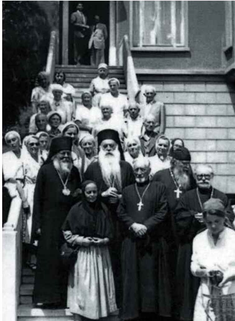
Русские паломники с Константинопольским Патриархом Афинагором. 1959 г.

— Согласен с вами, это было совершенно не канонично. Фанар ориентировался во многом на призывы обновленцев, которые были очень заинтересованы в поддержке своей церкви Константинопольским Патриархатом и постоянно писали ему, предлагая даже переехать на территорию Советской России, в частности в Москву, если турецкие власти потребуют от него окончательно покинуть Турцию 5 . Дело в том, что в это время стоял вопрос, сохранится ли вообще Константинопольский Патриархат. Когда в 1923 году турецкая армия под командованием Кемаля Ататюрка приближалась к Константинополю, турки