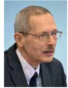
Михаил Витальевич Шкаровский,

д-р ист. наук, родился в 1961 г. Закончил исторический факультет Ленинградского государственного университета. В 2000–2002 гг. преподавал историю Русской Православной Церкви XX в. в Богословском институте (Санкт-Петербург). С 2009 г. — профессор Санкт-Петербургской духовной академии. С 2017 г. — профессор кафедры церковной истории Общецерковной аспирантуры и докторантуры имени свв. равноап. Кирилла и Мефодия. Главный архивист Центрального государственного архива Санкт-Петербурга. Автор 45 монографий, 2 учебников, 650 научных статей по истории Церкви.