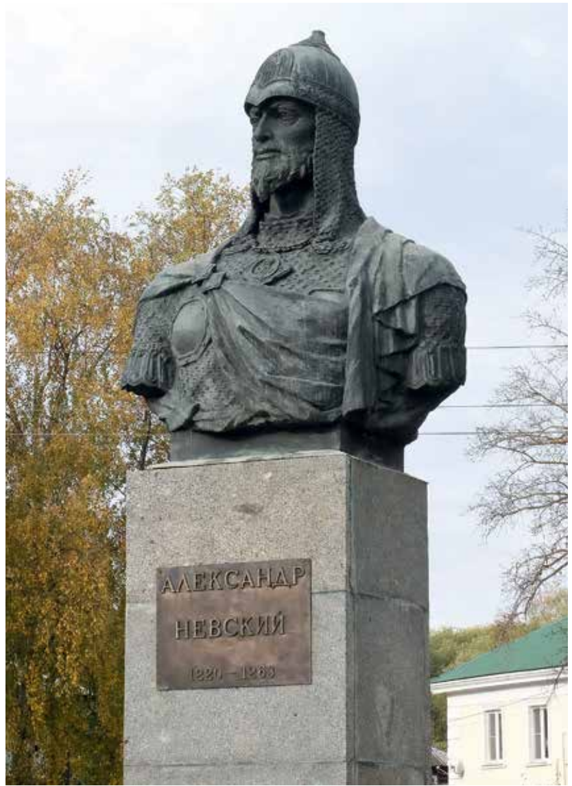
Памятник св. Александру Невскому возле Спасо- Преображенского собора

— Есть ли надежда, что Свято-Преображенский собор — одну из главных святынь Пе-