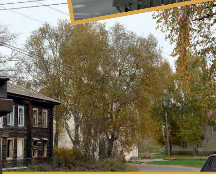
Храм прп. Симеона Столпника