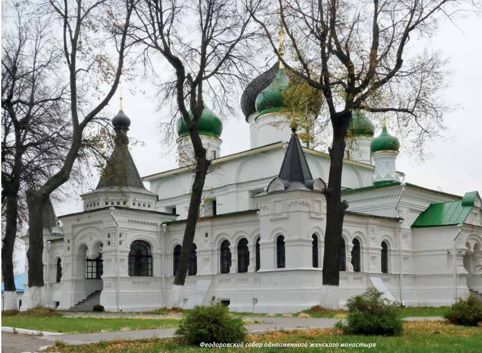
Феодоровский собор одноименного женского монастыря

залетная птица. У него нет возможности наладить с ними регулярное близкое общение.