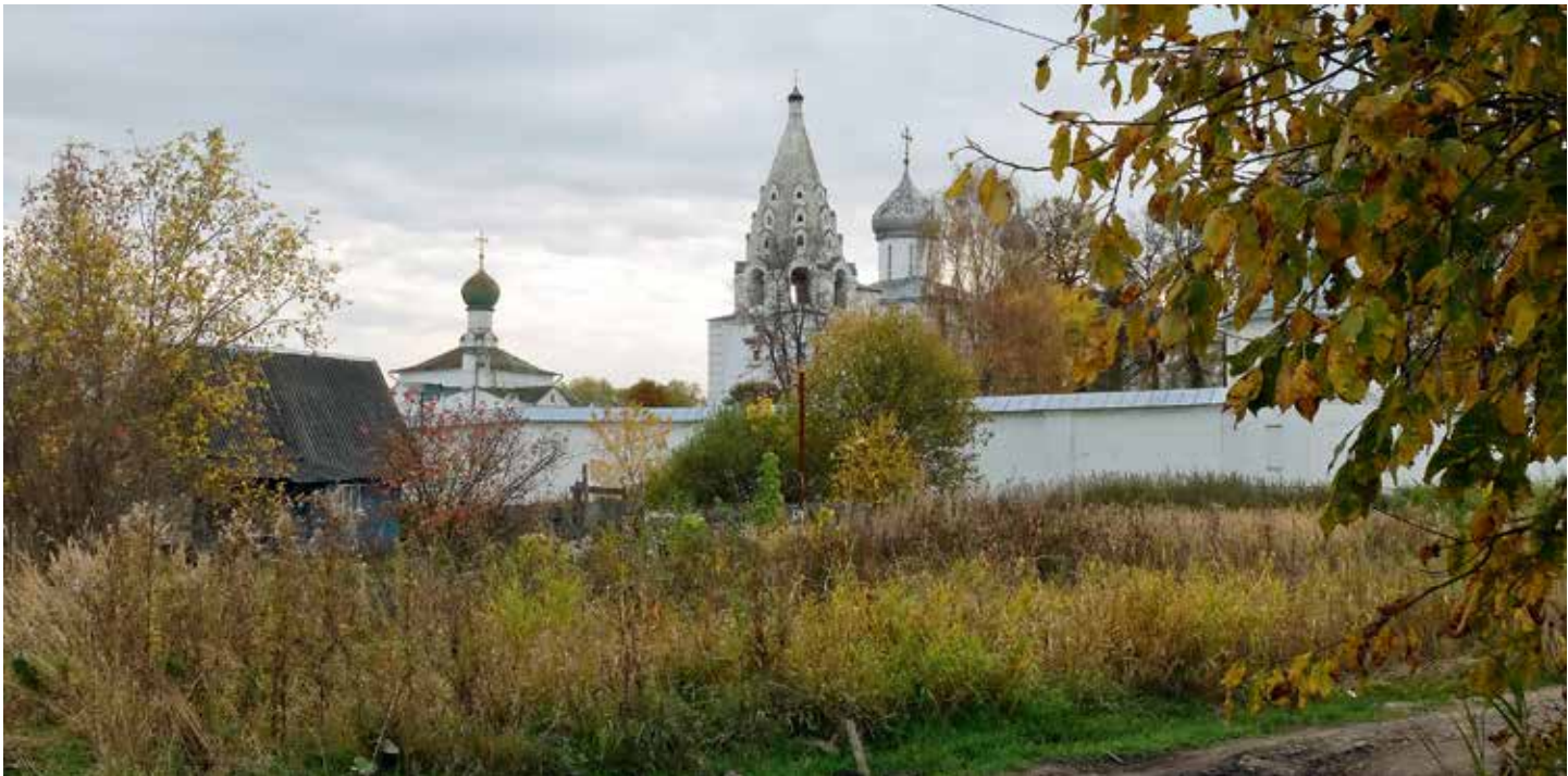
Свято-Троицкий Данилов монастырь

семьи. И часто бывает так, что их приход — это, собственно, их семья, то есть среди молящихся нет никого, кроме членов одной семьи. Конечно, в дачный сезон ситуация немного иная, но большую часть времени это именно так: отец семейства служит, его супруга поет, а дети помогают родителям — больше в храме никого нет.