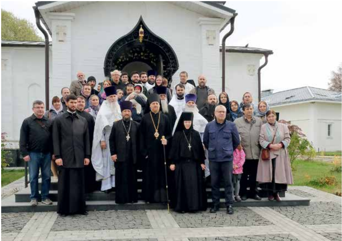
После освящения храма в честь св. блгв. императора Юстиниана. Село Годеново. 9 октября 2020 г.

— Часто да. Священники приезжают ко мне, мы пьем чай, беседуем. Стараемся делать это максимально неформально. Есть самые разные способы коммуникации (по телефону, в социальных сетях, на каких-то совместных мероприятиях), но это всегда индивидуально. Ведь каждый из батюшек такой же человек, как и я, — со своей болью, со своими сложностями и грехами. И я стараюсь быть для духовенства старшим братом. Тем, к кому совершенно не страшно обращаться за помощью. Я вижу, что священникам необходимо именно такое человеческое общение с архиереем, неформальное, теплое, братское. Наверное, каждому из нас нужен старший, к которому можно обратиться в сложной ситуации и о чем-то поговорить. Даже если ты не получишь совета, сам факт, что тебя выслушали, посочувствовали, прониклись твоей проблемой, уже очень важен.