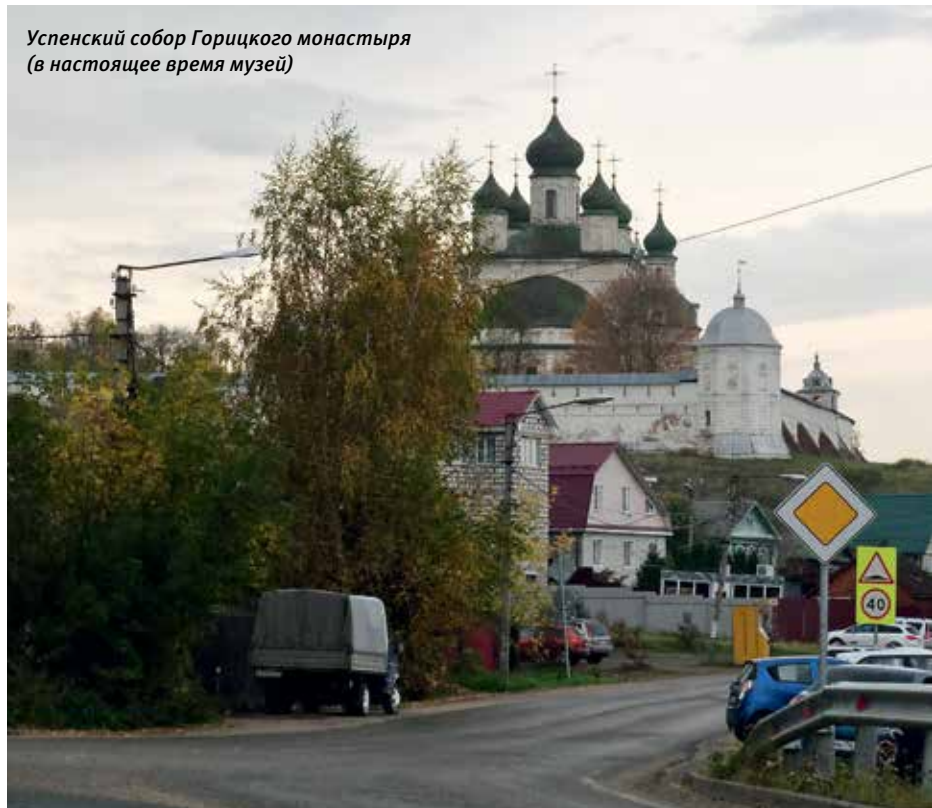
Успенский собор Горицкого монастыря (в настоящее время музей)