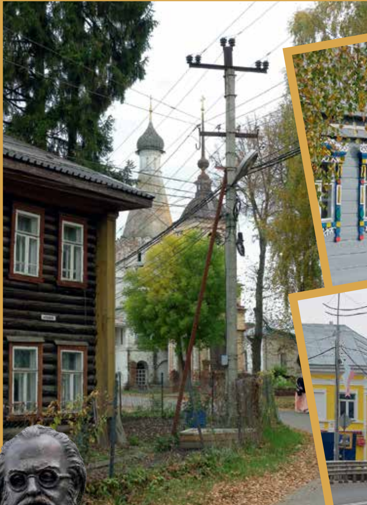
Храм в честь иконы Божией Матери «Знамение»