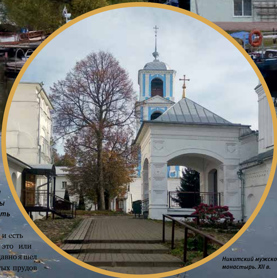
Никитский мужской монастырь. XII в.

— Для меня это сложный вопрос, и есть разные точки зрения. Проповедь это или нет — не могу сказать. Например, недавно я шел по Москве в подряснике мимо Чистых прудов