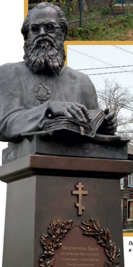
Памятник свт. Луке Крымскому в Феодоровском женском монастыре