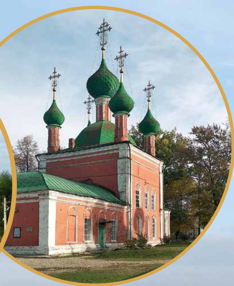
Храм св. блгв. кн. Александра Невского (Красная площадь)

Но даже если бы государство предложило епархии передать собор в ее собственность, мы не смогли бы это сделать, потому что тогда не будет государственной поддержки. А у епархии нет средств на содержание собора.