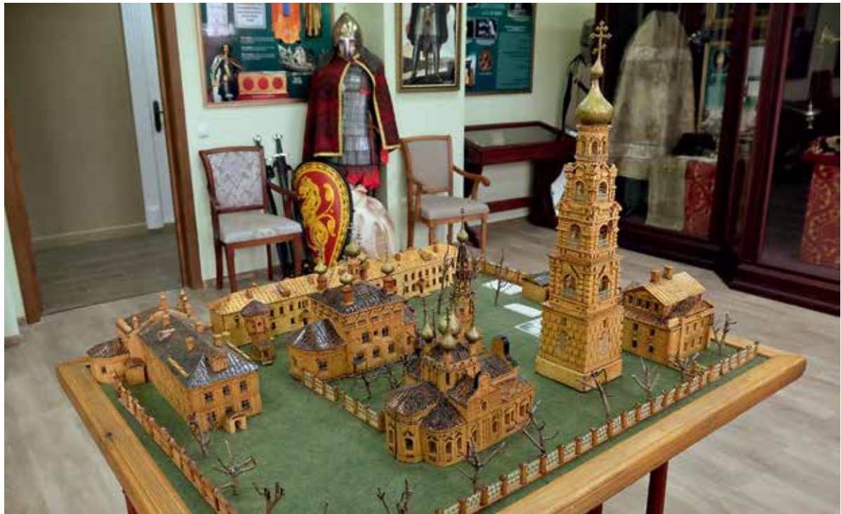
Макет Феодоровского монастыря в монастырском музее. Справа разрушенные храм Александра Невского (там теперь больница) и колокольня (на ее месте поклонный крест)

он, будучи еще митрополитом Смоленским и Калининградским, предложил внести имя Александра Невского в список проекта «Имя Россия» 1 , в котором по итогам голосования святой князь занял первое место», — говорит владыка.