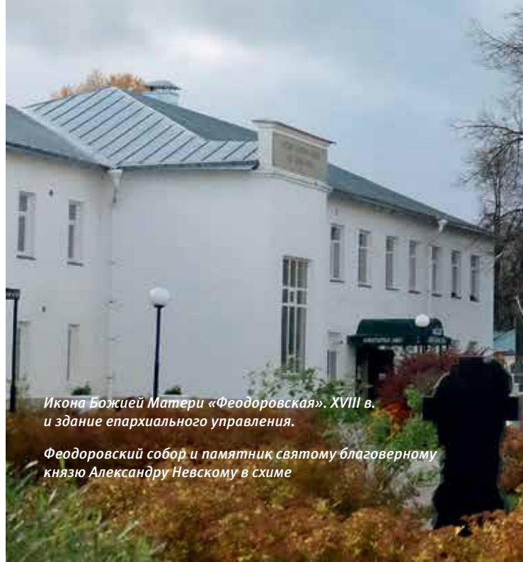
Икона Божией Матери «Феодоровская». XVIII в. и здание епархиального управления.