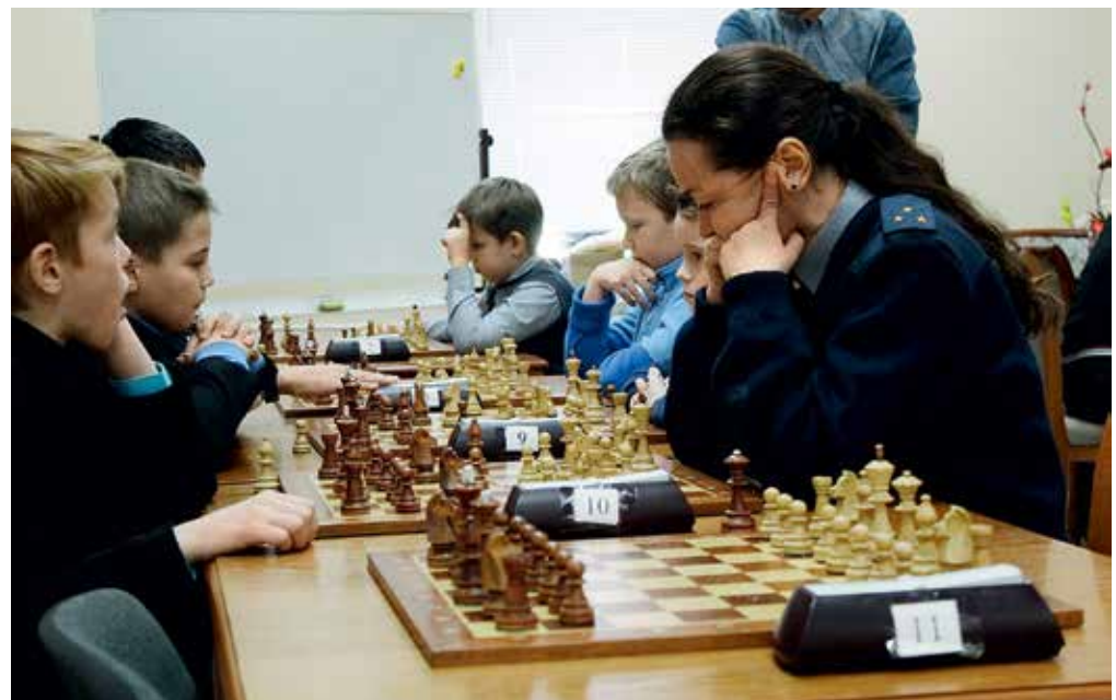
Епископ Городецкий и Ветлужский Августин в окружении паствы (вверху)