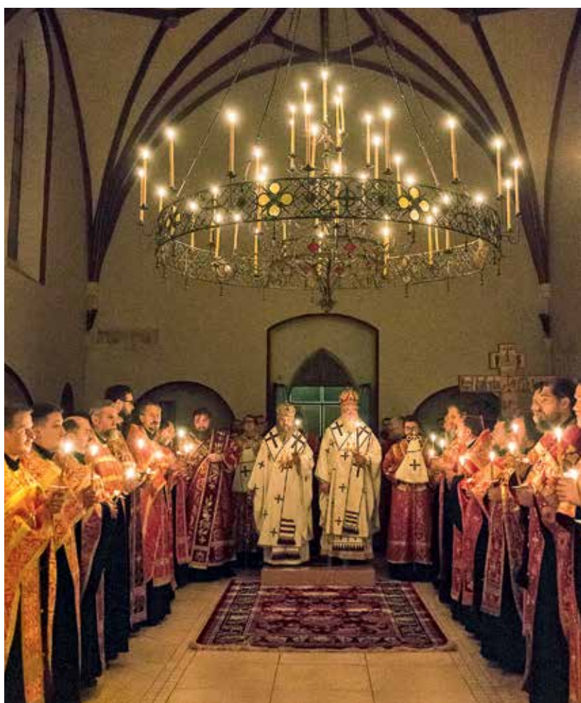
Престольный праздник в Екатерининском монастыре, 2019 г.

водой, — рассказывает матушка Феодосия. — Это плохо влияло на свод, в кровле зияли бреши». После удаления чужеродного асфальта и искусственно насыпанного слоя земли удалось просушить капитальные конструкции и защитить их