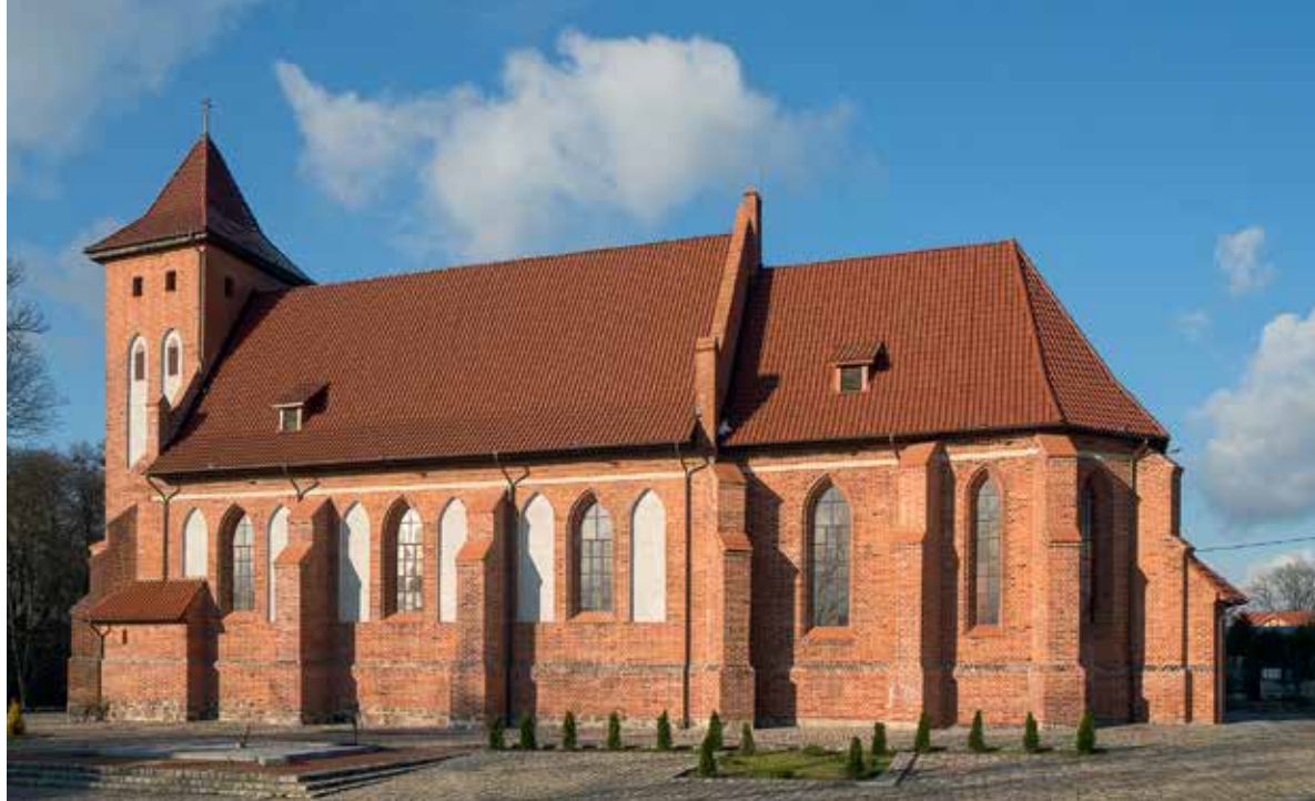
Соборный храм Екатерининского монастыря (бывшая кирха в Арнау)