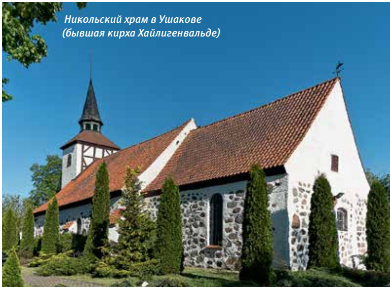
Никольский храм в Ушакове (бывшая кирха Хайлигенвальде)