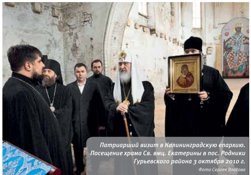
Патриарший визит в Калининградскую епархию. Посещение храма Св. вмц. Екатерины в пос. Родники Гурьевского района 3 октября 2010 г.

На первом этапе восстановительных работ неограниченную помощь оказали реставраторы из Польши — страны с авторитетнейшей школой