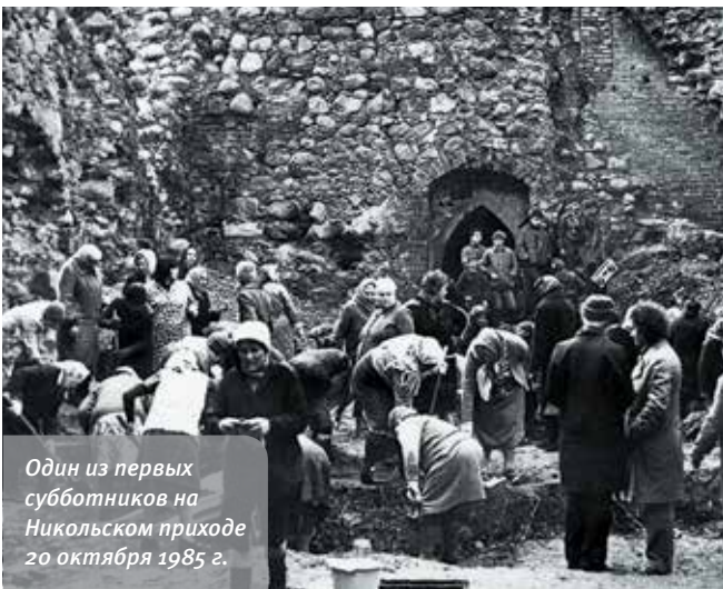
Один из первых субботников на Никольском приходе 20 октября 1985 г.