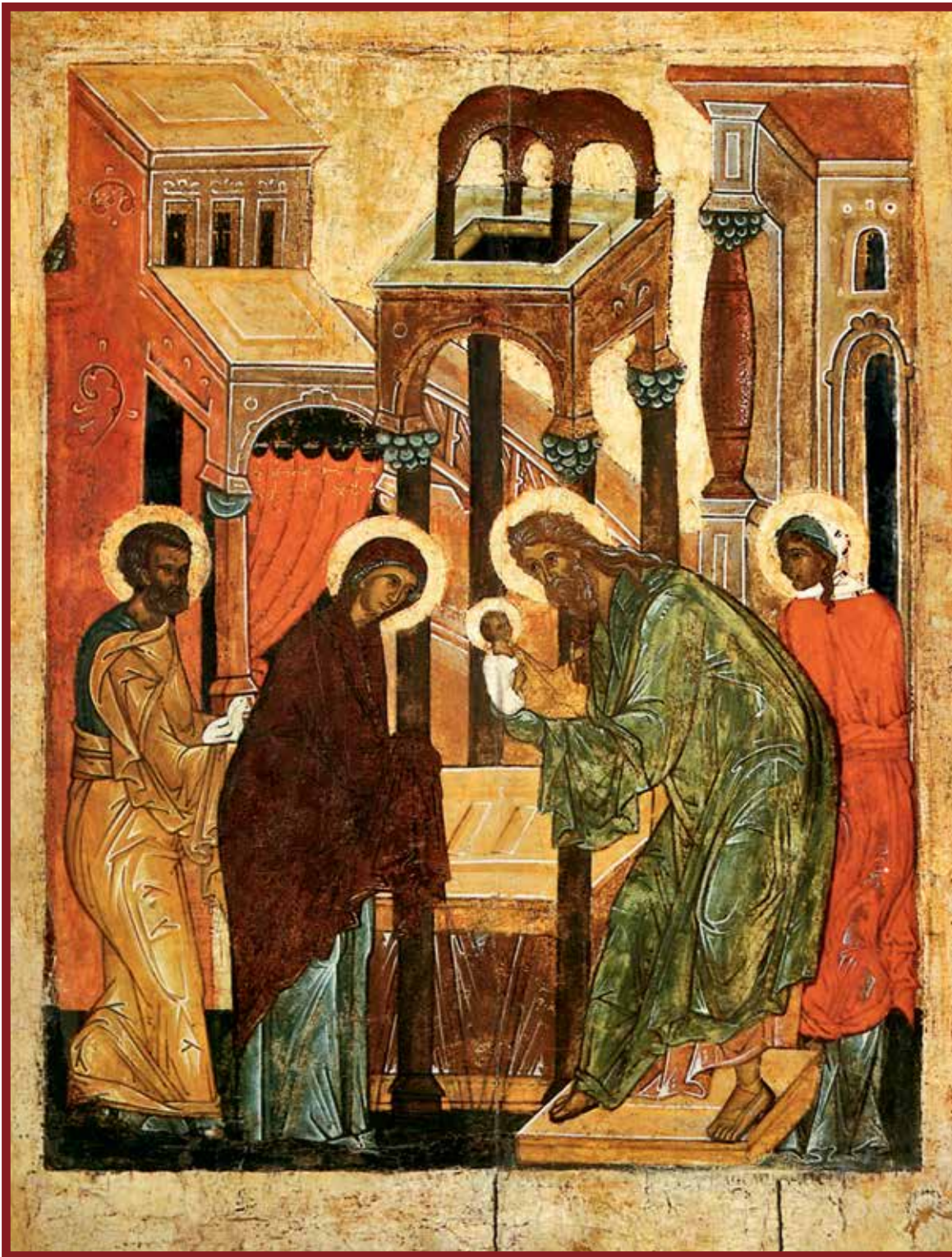
Икона Сретения Господня. Кон. 1540-х гг., Россия. Псковский государственный объединенный историко- архитектурный и художественный музей-заповедник

ка, — ритуальное очищение Богоматери, представление Ее Сына Богу и встреча с двумя ветхозаветными праведниками — воплотилось в трех основных названиях праздника: Очищение Марии (Purificatio Mariae), Представление Господя (Praesentatio Domini) и Встреча Господя (Ἡ Ὑπαπαντή τοῦ Κυρίου). На Востоке превалиро-