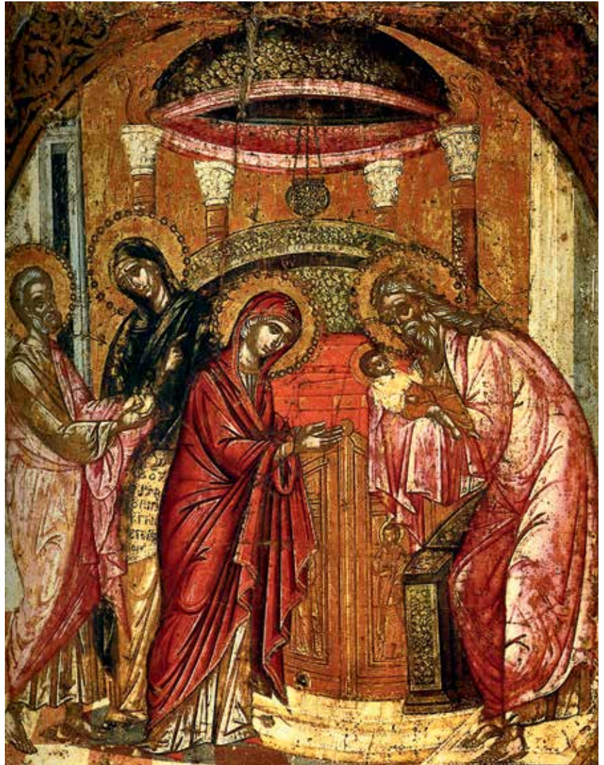
Икона Сретения Господня. Последняя четв. XVII в. Крит. Музей Банаки, Афины