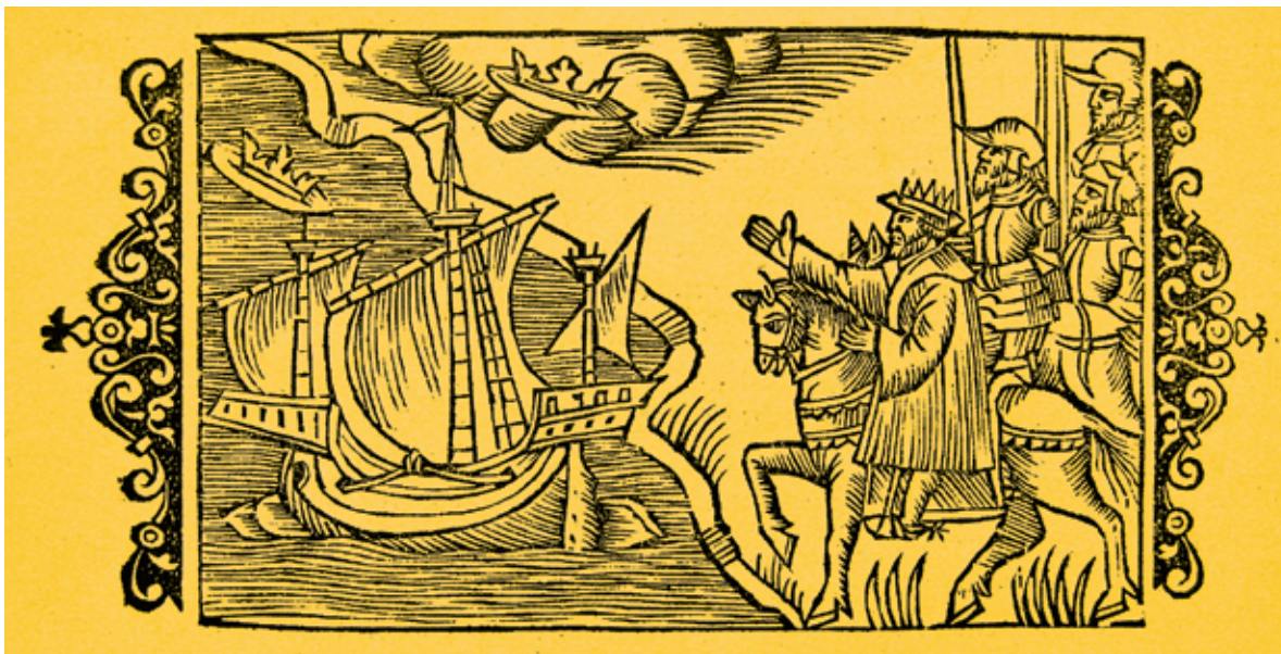
Король Норвегии Хакон IV Старый повелевает отомстить биармийцам. Рисунок из книги «История Северных народов». Olaus Magnus. Romae, 1555

Таким образом, именно в середине XIII века стало очевидным, что прежняя политика