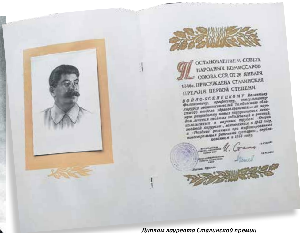
Диплом лауреата Сталинской премии

погружении в его биографию мы, впрочем, понимаем, что она основывалась на твердом фундаменте характера и личных убеждений. Ведь он мог бы стать хорошим художником — но решает, что доверяться этому душевному влечению неправильно, а гораздо больше пользы он принесет в медицине. После университета ему предлагали заниматься наукой на кафедре — но он