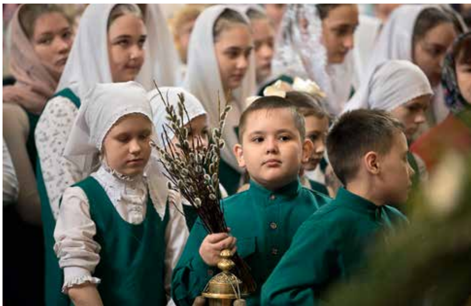
Пасхальный епархиальный бал в концертно-театральном центре «Югра-Классик» г. Ханты-Мансийска (вверху) Учащиеся православной гимназии г. Ханты-Мансийска (внизу)

Но растет число прихожан и в наших храмах. И характерно, что в большинстве своем это люди в возрасте 35–40 лет, с детьми, это очень радует.