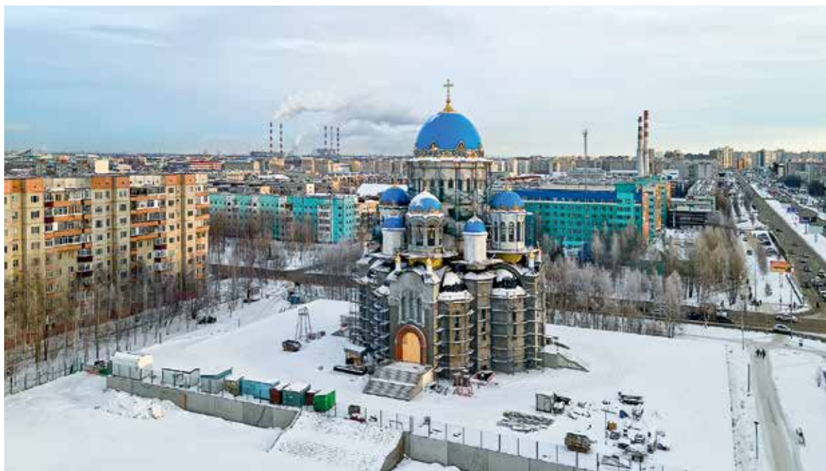
Строящийся Троицкий кафедральный собор

— Одних, конечно, приглашал, а кто-то сам просился ко мне, ведь у нас северный край, здесь есть свои преимущества, в епархии действует программа социальной поддержки священно- и церковнослужителей. Отпуск у духовенства у нас, к примеру, 44 дня, как и в мирских организациях. Такого нет в соседних епархиях. Различные меры поддержки сделали нашу епархию