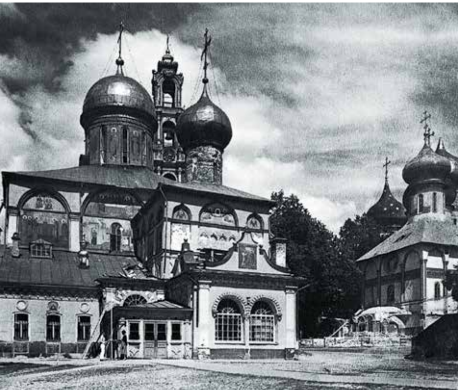
Троицкий собор, Никоновский придел и Серапионова палатка с южной стороны. Фото 1939 г.