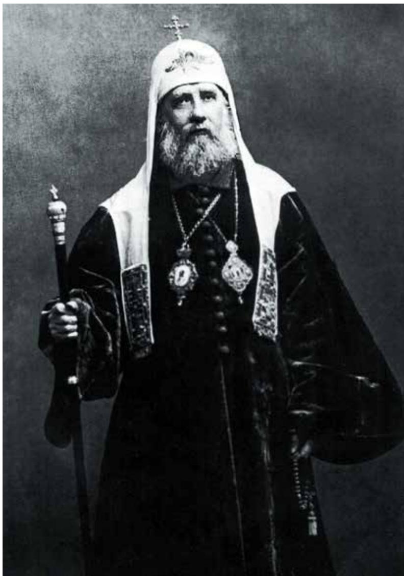
Патриарх Московский и всея России Тихон

заменено Синодом, а Соборы фактически перестали собираться. Теперь же предполагалось установить одновременное сосуществование Синода, возглавляемого Патриархом, и Собора под председательством того же Патриарха. Эксперты нащупывали почву сопряжения канонических правил, исторических прецедентов, текущих нужд Церкви и современных взглядов на церковное благо.