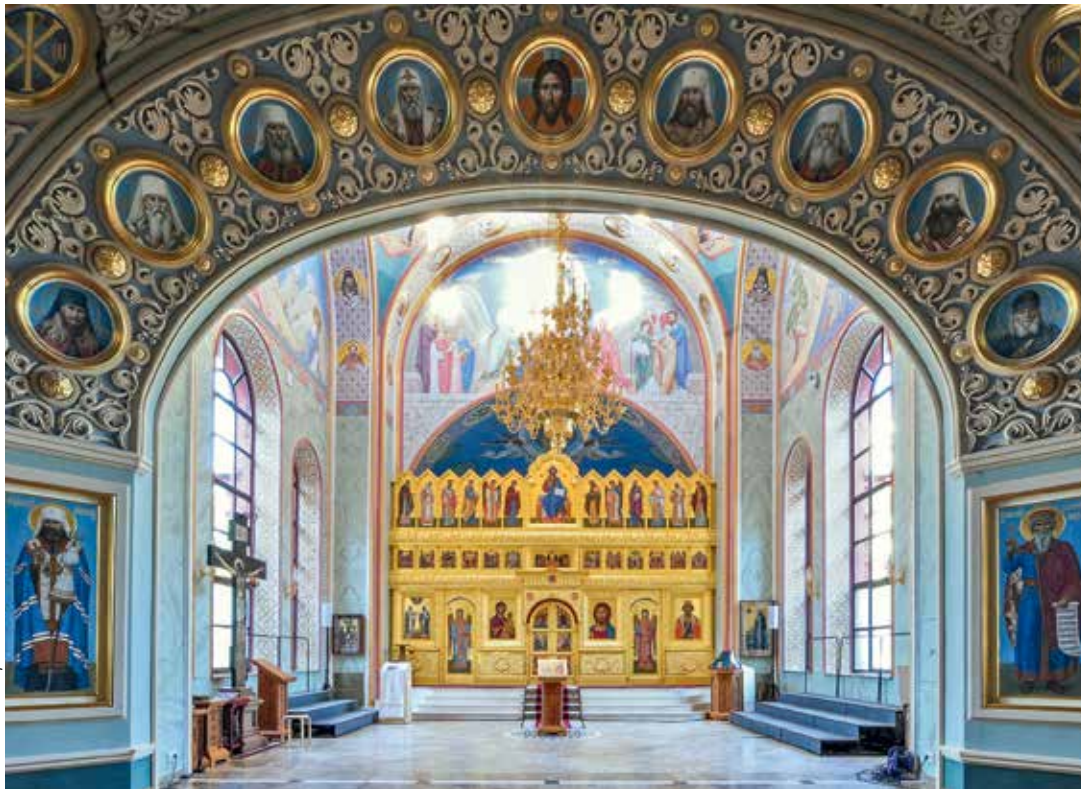
Фото Михаила Еремينا