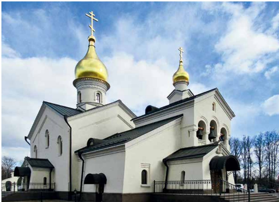
Казанская церковь в Мещерском. Москва

на профессиональном уровне и подвигло меня к созданию архитектурного бюро «Арххрам». С детства человек верующий, я быстро увлекся этой темой. Когда же мастерская в «Моспроекте-2», занимавшаяся музеем на Поклонной горе, выполнила свою задачу и прекратила работу, мне удалось получить благословение Патриарха Алексия II на труды на новом поприще. С той минуты сомнения отпали.