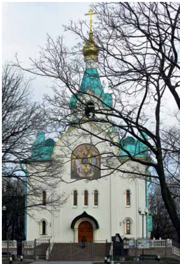
Храм св. прав. Иова Многострадального на Можайском шоссе. Москва

на целый мегаполис концепции храмоздательства не применялся прежде нигде и никогда. Этот смелый эксперимент совпал с переживаемой российским обществом эпохой церковного возрождения, когда отношение массового сознания к храмовому зданию как особому элементу городского ландшафта (как правило, архитектурному памятнику) стало уступать место его восприятию в качестве обычного компонента застройки. Конечно, Храм Христа Спасителя или Никольский Морской собор возвышаются над рутинными элементами пейзажа, это архитектурные шедевры. Но в каждом районе шедевр не поставишь. А у нас даже не в районе — в одном многоэтажном доме сегодня обитает население трех традиционных русских деревень.