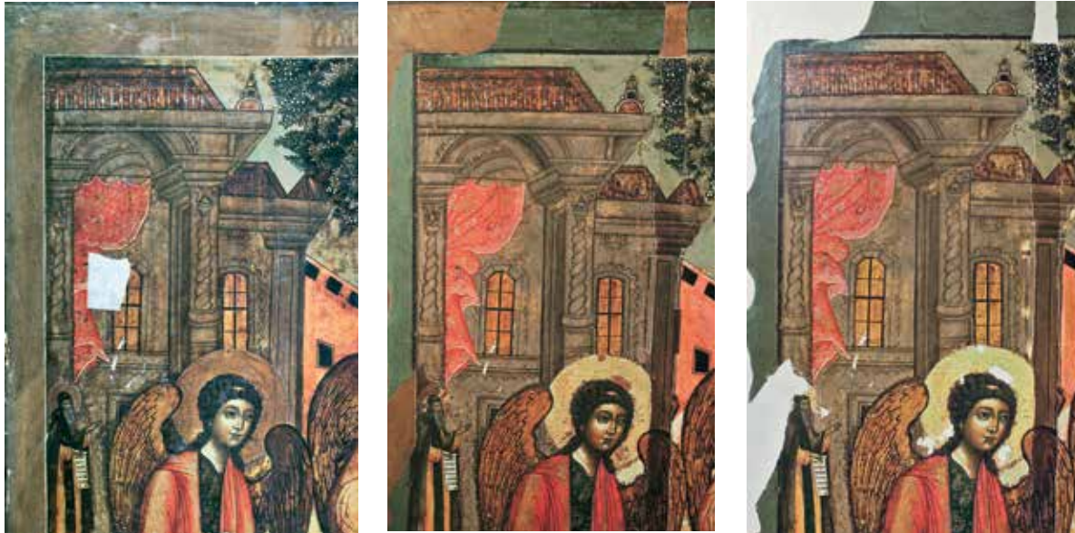
Фрагмент иконы в процессе реставрации