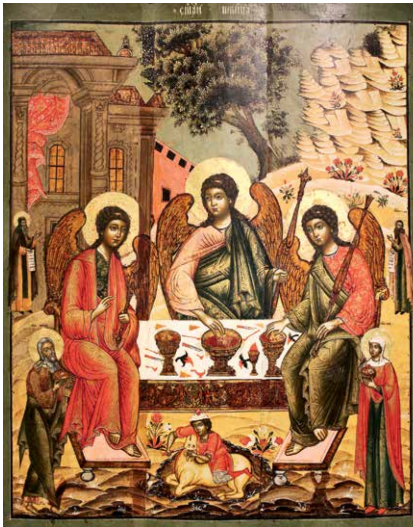
Справа икона до реставрации

Ее реставрация заняла десять лет и завершилась только что. Икона Пресвятой Троицы из московского Преображенского храма в Спасской слободе — то из немногих, что уцелело от этой некогда богатейшей приходской церкви древней российской столицы; от самого же домовладения до нас дошла только... чугунная кованая ограда (давным-давно перенесенная к другому храму — святых апостолов Петра и Павла на Новой Басманной улице). Не считая, разумеется, собственно топонимов — Садовой-Спасской и Большой Спасской улиц, наименованных по слободе, унаследовавшей в свою очередь название от известного с 1625 года храма, который в то время был деревянным.