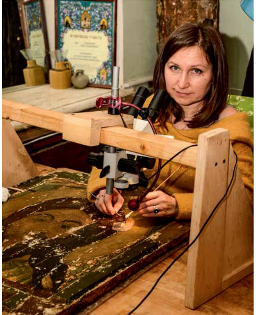
Реставрация иконы проводилась в мастерских Государственного научно-исследовательского института реставрации

Для хранения святыни был изготовлен специальный киот с климат-контролем. В храме поддерживаются необходимые температурно-влажностные показатели. Для круглосуточной охраны