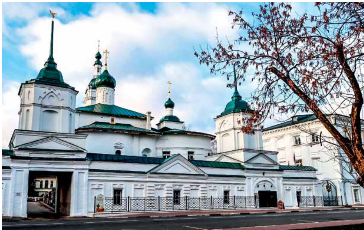
Спасо-Афанасиевский мужской монастырь