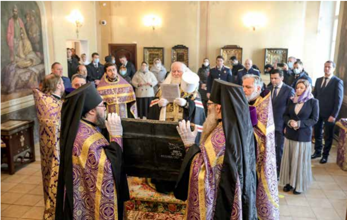
В торжественной передаче иконы монастырю приняли участие митрополит Ярославский и Ростовский Вадим, губернатор Ярославской области Дмитрий Миронов и министр культуры РФ Ольга Любимова

Ярославского художественного музея. Но уже в то время было сложно определить, тот ли это чудотворный образ или поздний список с него.