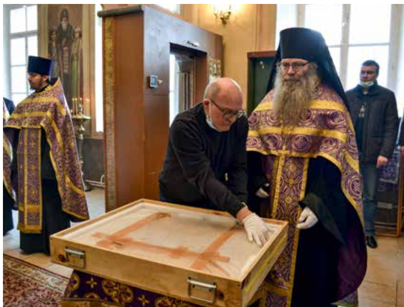
Для чтимой иконы был изготовлен специальный киот

находилась икона: «тайная сила остановила несших чудный образ; никак не могли они двинуться с места».