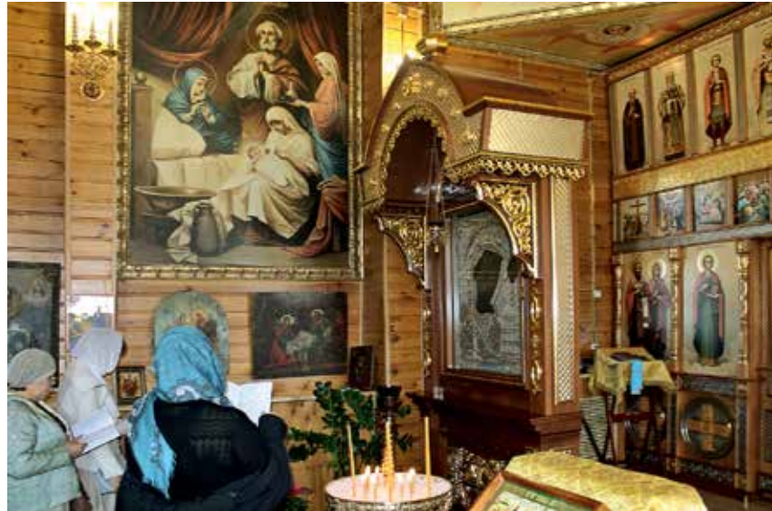
Чимеевская икона Божией Матери располагается в храме в честь образа Богородицы «Неупиваемая Чаша»

— Прежде всего считаю нужным заметить, что благодать Божия здесь по-прежнему ощущается, это место ее не потеряло. Я тут всего два года, поэтому о духовных выводах могу рассуждать с определенной осторожностью. Создается впечатление, что чимеевцы с какого-то момента в корне неверно стали относиться и к монастырю, и к главной его святыне. Чимеевский Казанский образ стал для них источником заработка, средством привлечения паломников из богатой Тюмени. А отсюда уже недалеко до олицетворения его с идолом. Такая трактовка, конечно, в корне противоречит азам нашей веры, да и Самой Божией Матери, вероятно, очень неприятно было все это наблюдать.