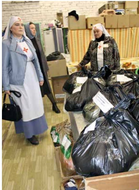
Сестры милосердия готовятся разбирать свежую партию вещей, поступивших в епархиальный центр гуманитарной помощи

У святого источника Казанского Чимеевского мужского монастыря в среду малоллюдно, а в воду и вовсе никто не окунается. Но вот у часовни