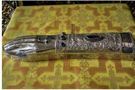
Частица мощей небесного покровителя Зауралья святого благочестивого Александра Невского (слева)

Центр гуманитарной помощи «Милосердие» при храме Порт-Артурской иконы Божией Матери на улице Ястржембского может послужить примером и для многих подобных столичных площадок, не говоря уж о провинциальных. Помещения под него Церкви выделило Научно-производственное объединение