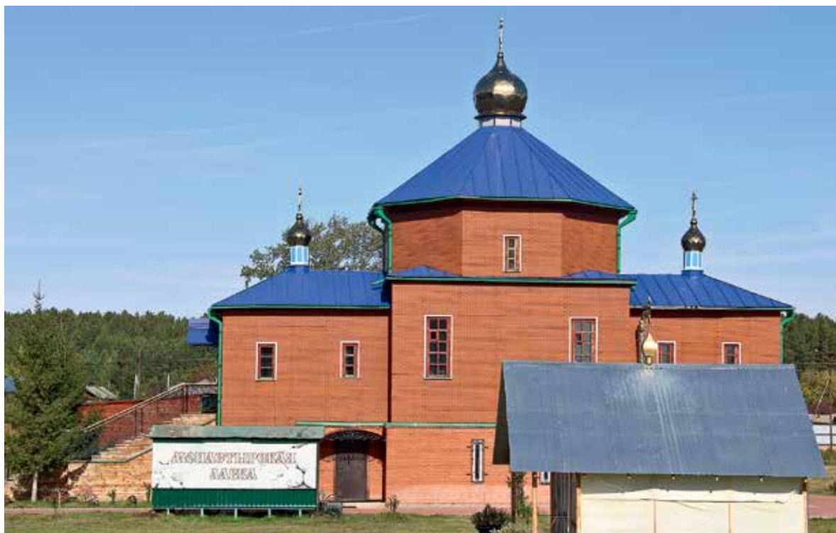
На монастырской территории