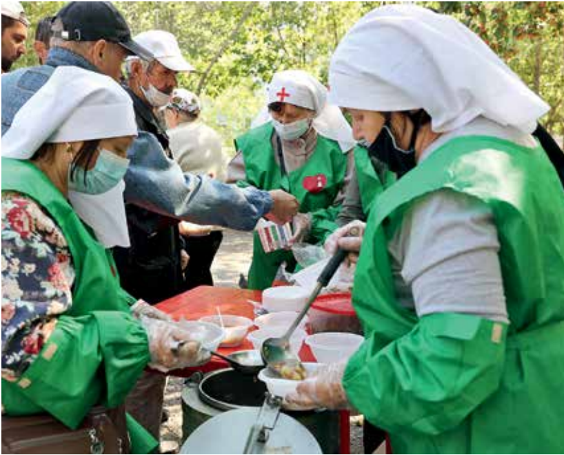
Ежедневное кормление бездомных в Сквере милосердия