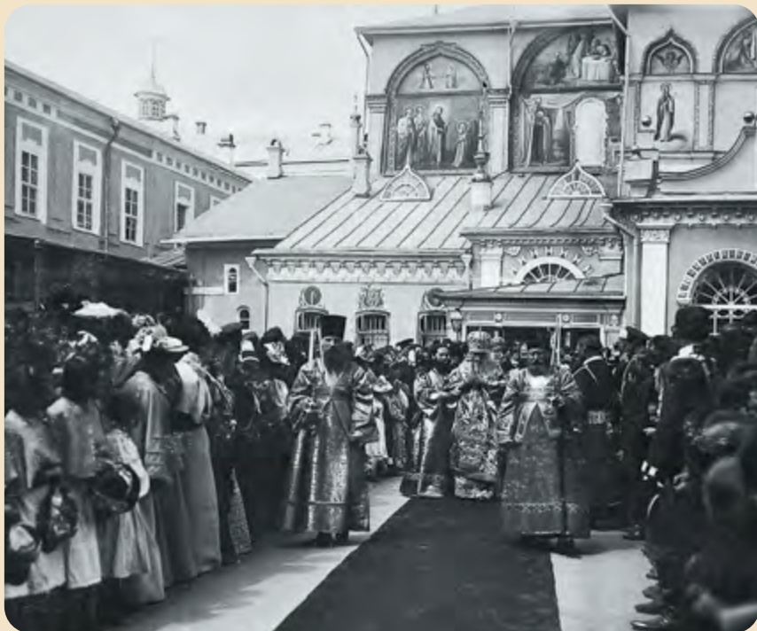
Крестный ход на Пасху 1946 г. (справа)