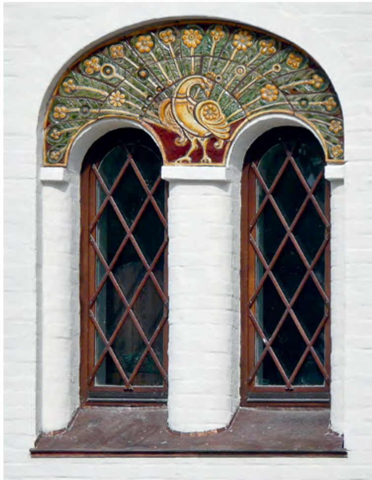
Владимирский скит на Валааме

— Что значит хороший? Удобный, большой, из качественных материалов, с добросовестными строителями, толковыми архитекторами, искусными иконописцами — да, наверное, дорого. Но если сравнить с качеством работ за более низкую стоимость, то вполне возможно, что это окажется не так уж и дорого. Я, к примеру, знаю, за сколько возводят храмы другие артели и за сколько строим мы. Деньги практически одни и те же. Но у нас работают люди, которые проектируют и строят только храмы, и они очень хорошо знают, что они делают. А часто бывает, что люди приступают к работе, не имея никакого опыта в церковном зодчестве. Это всегда плохо заканчивается. Будут частые ремонты, замучают промерзания. Одним словом, будут проблемы, которые поглотят всю эту призрачную экономию.