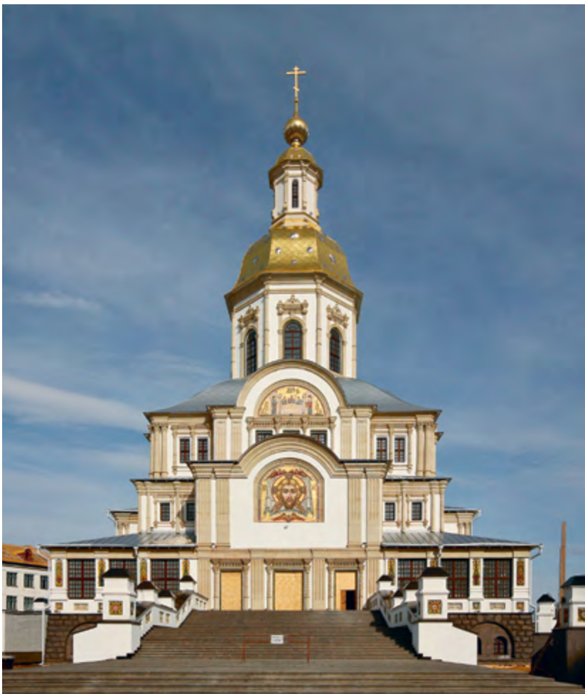
Благовещенский собор в Серафимов-Дивеевском монастыре

тектура сформировала новый стиль — русский модерн.