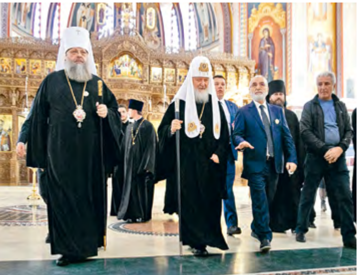
Патриарший визит в Донскую митрополию. Посещение Благовещенского храма г. Ростова-на-Дону 27 октября 2019 г. (слева)