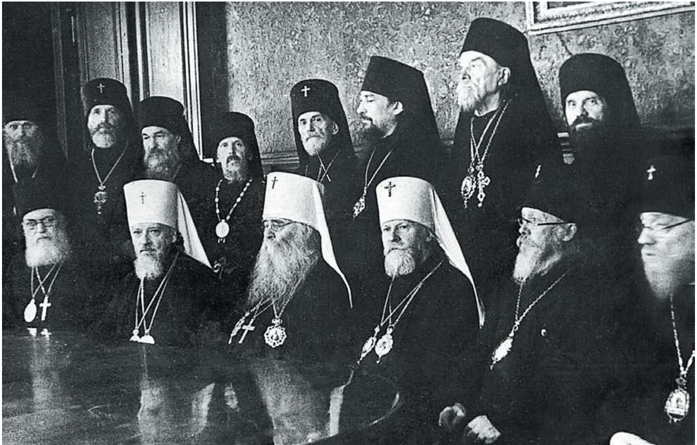
Заседание Архиерейского Собора и выборы Патриарха