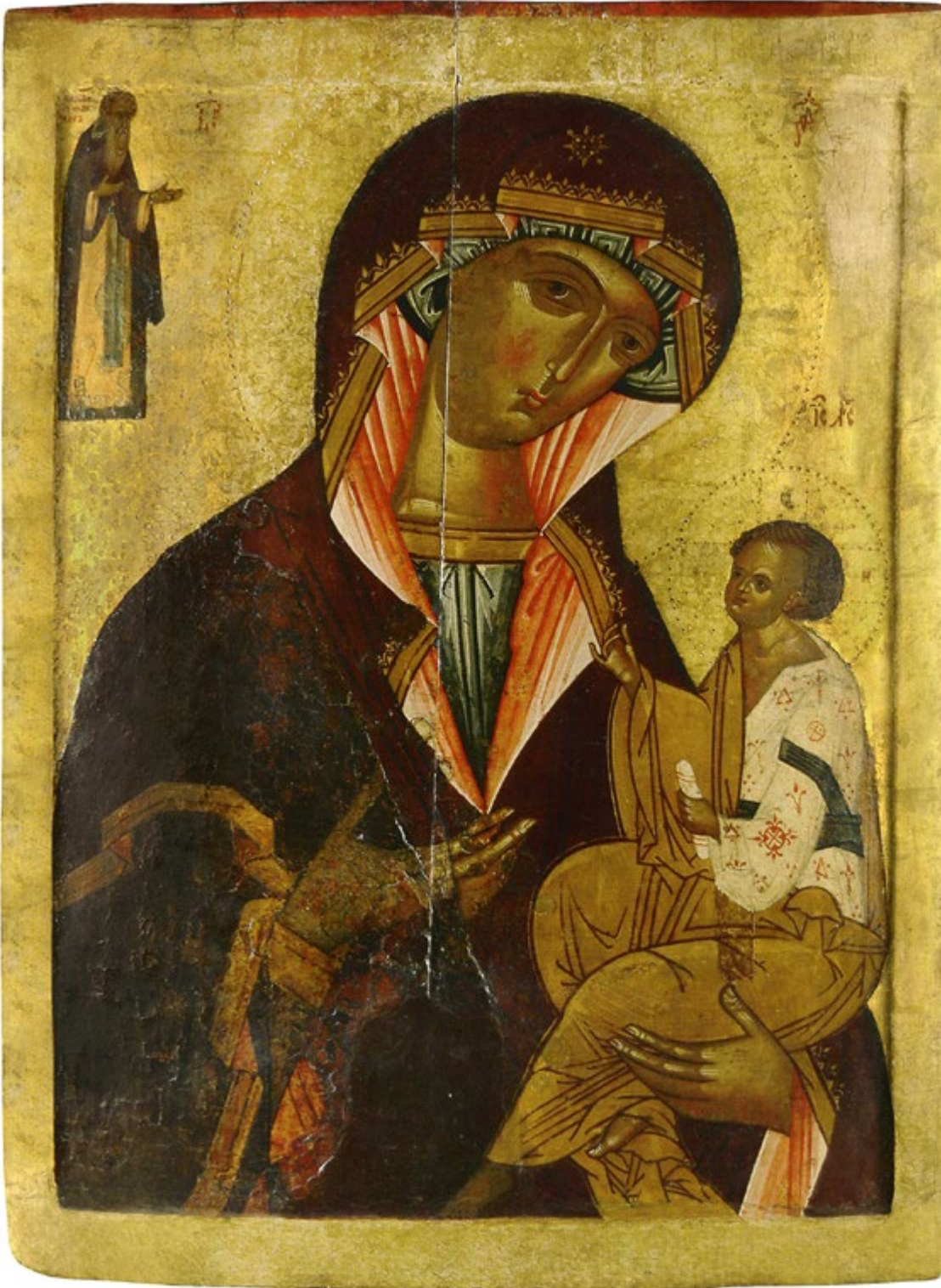
Богоматерь Оди- гитрия, с премо- добным Иоанном Лествичником. Происходит из церкви Входа Господня в Ие- русалим в Кар- гополе. Конец XV в. Вологодский государствен- ный историко- архитектурный и художествен- ный музей- заповедник

брось сей троерожник, все один рог станет вверх. 6. Тщеславный человек есть идолопоклонник, хотя и называется верующим. Он думает, что почитает Бога, но в самом деле угождает не Богу, но людям».