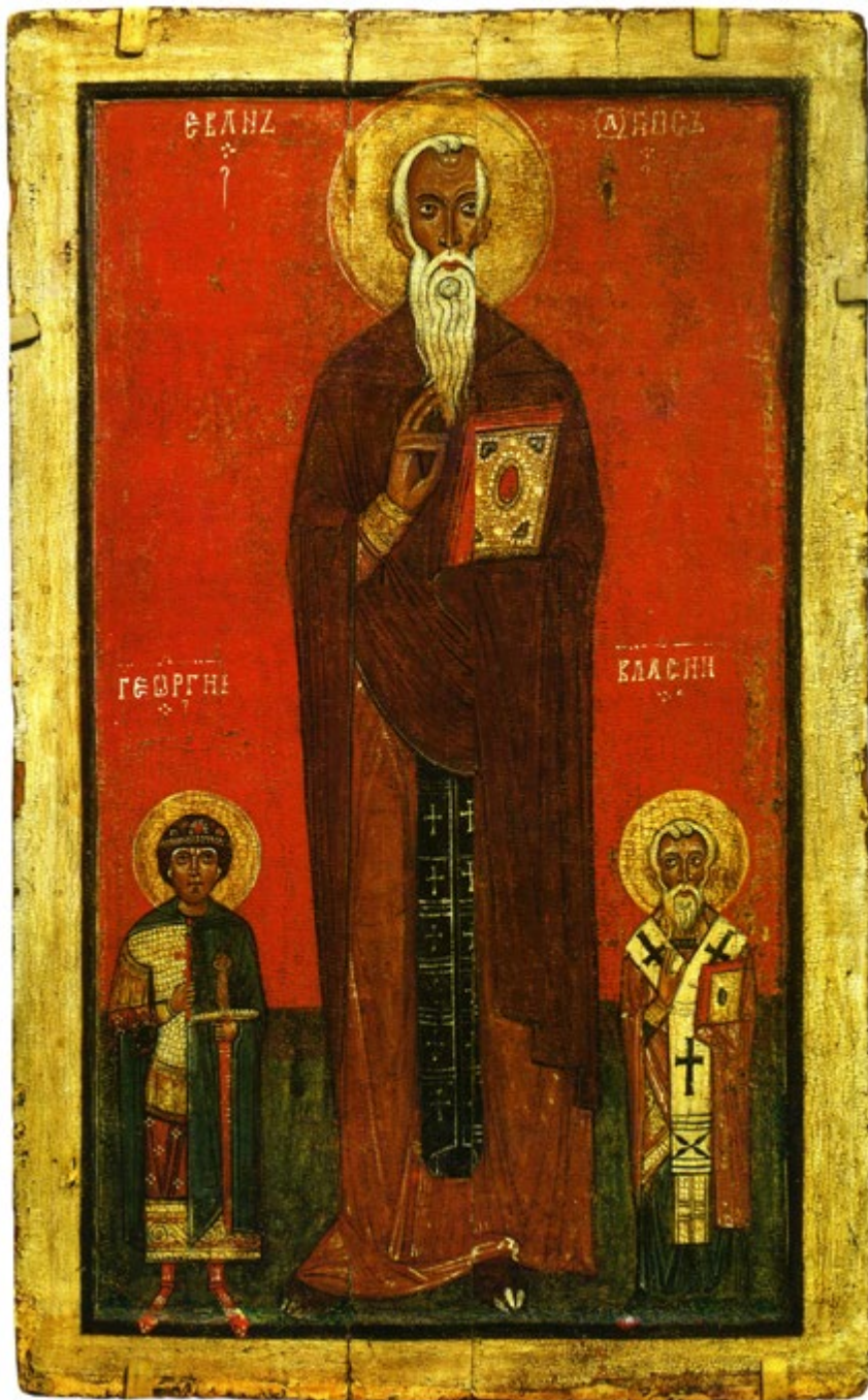
Иоанн Лествичник, Георгий, Власий. Последняя треть XIII в. Новгородская школа. Государственный Русский музей

под ударами, они говорили: мы не имеем ни начала, ни рождения, ибо мы сами начальницы и родительницы всех страстей. Немало ругает против нас сокрушение сердца, рождаемое от повиновения... <...> Мы родительницы всего противного смиренномудрию, а что оному спешествует, то нам противостоит. <...> Наши исчадия суть падения мужей духовных: гнев, клевета, досада, раздражительность, вопль, хула, лицемерие, ненависть, зависть, прекословие, своенравие, непокорство. Есть только одно, чему мы не имеем силы противиться... если