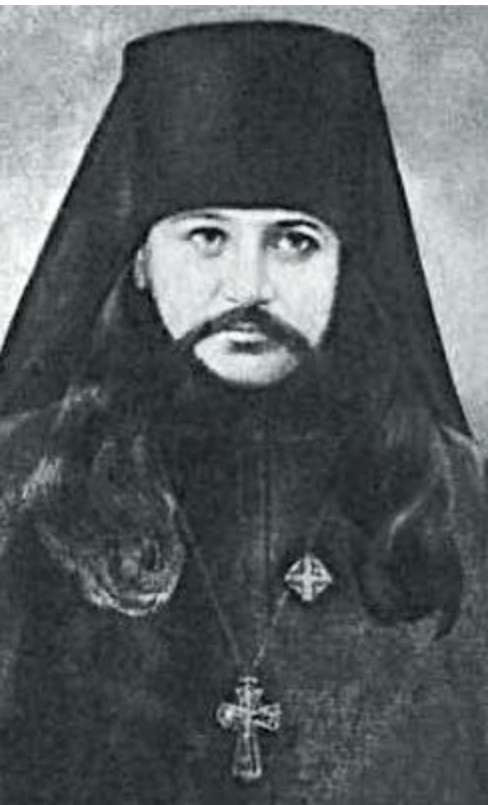
Архимандрит Хрисанф (Щетковский) (слева)