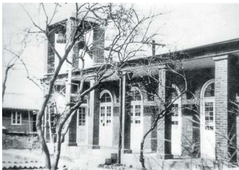
Вид Русской дипломатической миссии в Сеуле. 1901 г. (вверху)