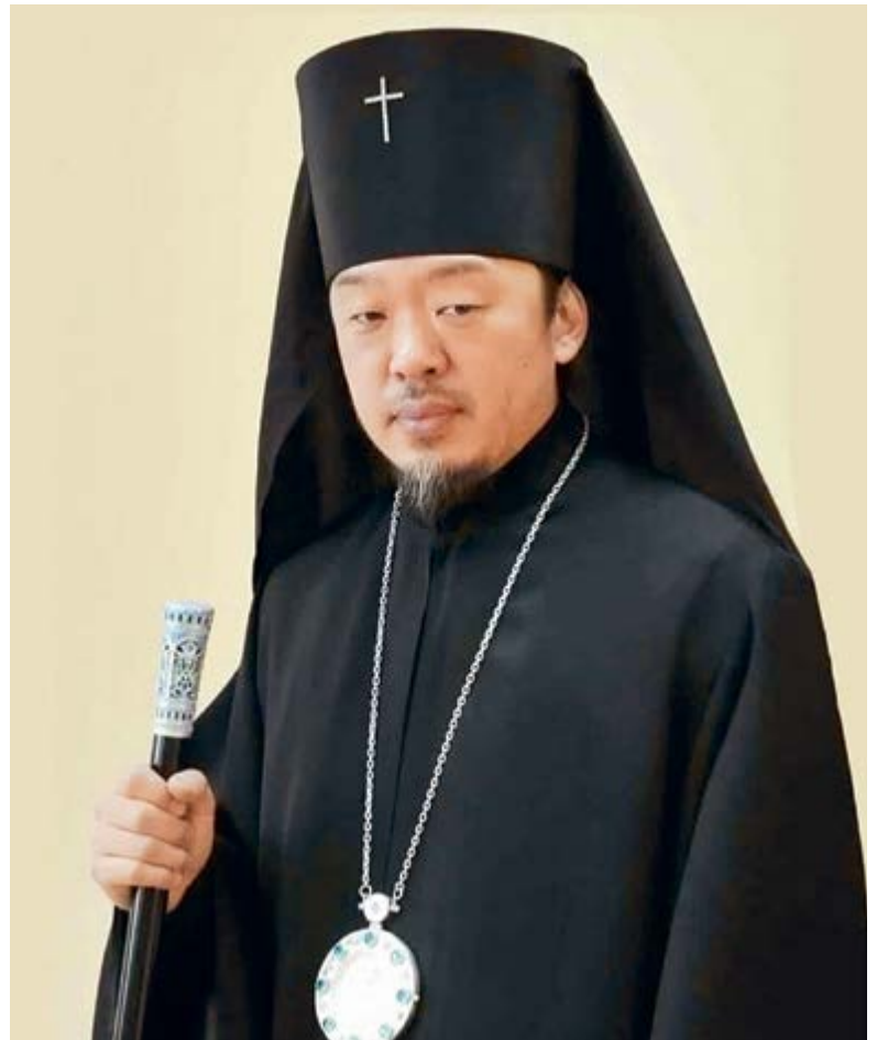
Феофан, архиепископ Корейский

На сегодняшний день перед Корейской епархией стоит задача по устройению полноценной церковной жизни в городах, где проживает русскоязычное население. В Республике Корея число постоянно проживающих граждан Российской Федерации составляет около 60 тысяч человек, помимо них в Корее зарегистрировано значительное число русскоязычных граждан из стран СНГ. Ежегодно Южную Корею посещают сотни тысяч российских туристов. В последние