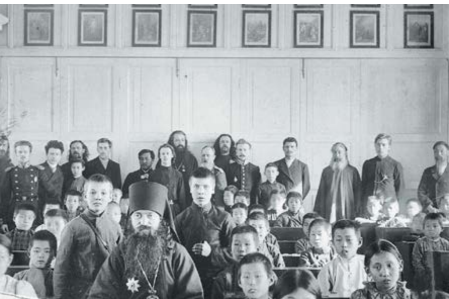
Корейские переселенцы в Приморье. Конец XIX в. (вверху)