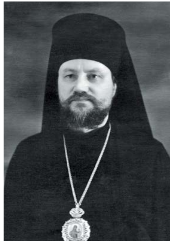
Епископ Поликарп (Приймак) (справа)

в миссии еще оставались средства, полученные ранее, то с наступлением 1918 года она лишилась высылаемых ей ежегодно сумм.