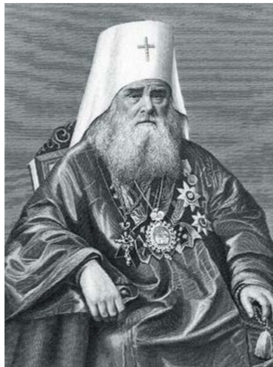
Святитель Иннокентий (Вениаминов)

указ о его запрете и до 1872 года подвергало христиан суровым гонениям. Однако, несмотря на это, число христиан постоянно росло, причем прежде всего в среде интеллектуалов, а затем и среди простого народа. Число крещеных корейцев к 1801 году составило десять тысяч человек. В 1872 году, после прихода к власти короля Коджона, христианство было неофициально признано «терпимой» религией. После открытия Кореи с 1882 года в страну стали проникать протестантские миссионеры, чьи проповеди также оказались весьма успешными. Общее