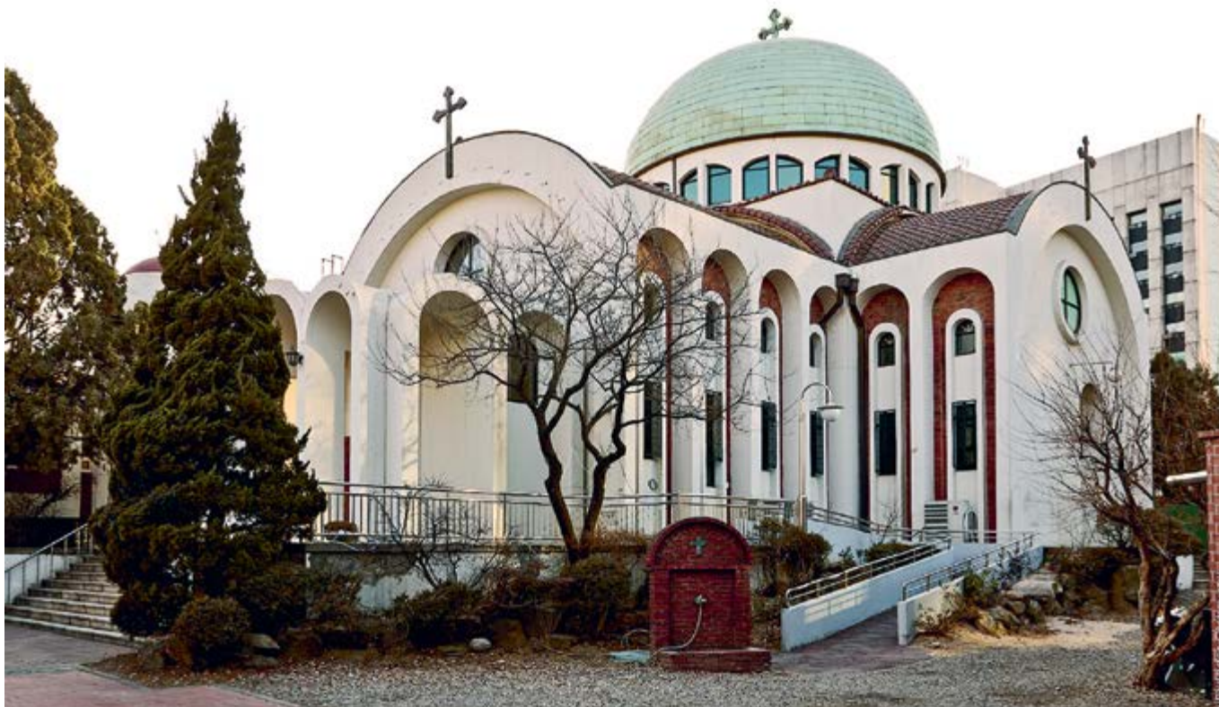
Церковь во имя святителя Николая Чудотворца в Сеуле

представительств и выполняет исключительно мирные задачи.