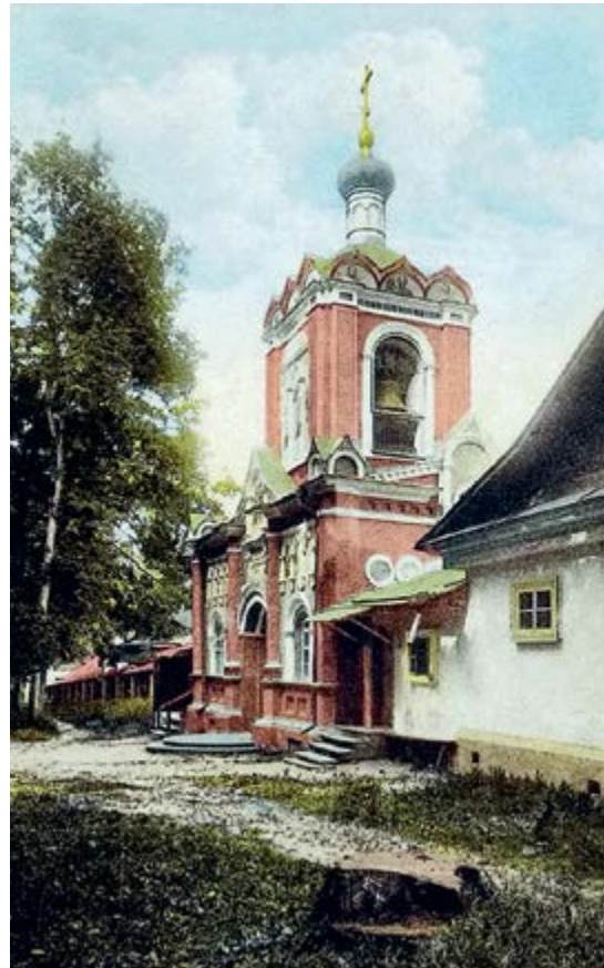
Храм в честь Собора Предтечи и Крестителя Господня Иоанна в Иоанно-Предтеченском скиту (слева)