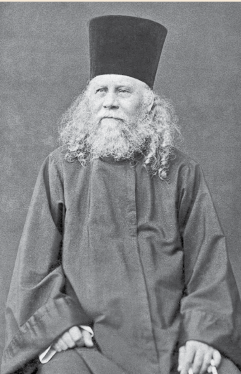
Иеромонах Анатолий Оптинский. 1878 г.