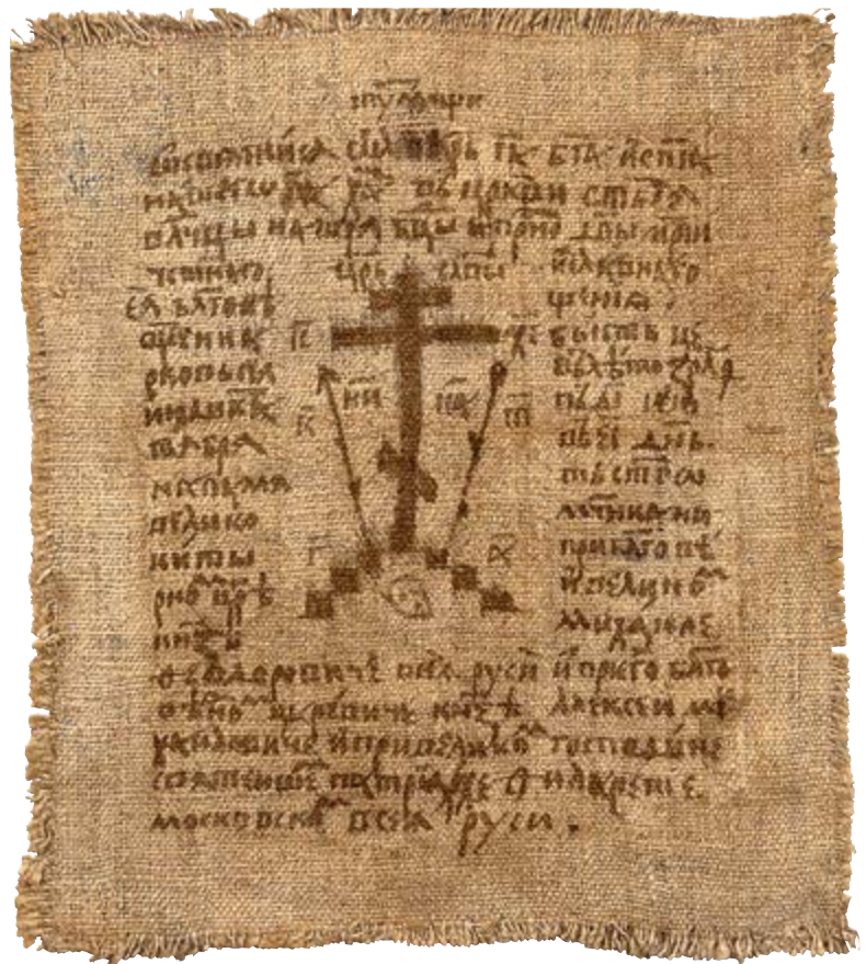
Антиминс церкви Благовещения (Голгофский Крест). Неизвестный автор. 1630 г. Холст, чернила, перо, кисть. 22,5 x 19,5 см. Музей христианского искусства «Церковно-археологический кабинет» Московской духовной академии