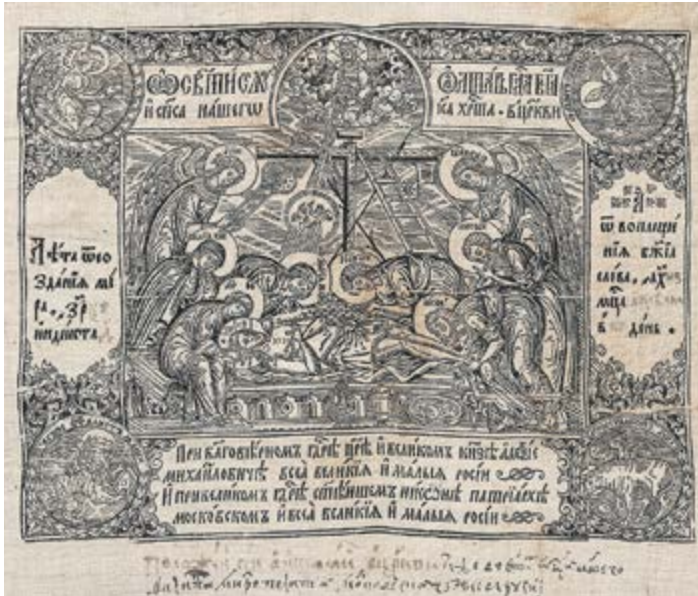
Антиминс «Положение во гроб». 1657 г. (доска 1655 г., 1-е издание). Холст, гравюра на дереве, типографский набор, чернила, перо. 44,5×49,0 см. Музей христианского искусства «Церковно-археологический кабинет» Московской духовной академии

Антиминс «Оплакивание Христа». И. А. Соколов, В. А. Иконников, по оригиналу Э. Гриммеля. 1764 г. (доска 1756 г.). Церковь святой великомученицы Варвары. Шелк, офорт, резец, чернила, перо. 46,5×55,0 см. Музей христианского искусства «Церковно-археологический кабинет» Московской духовной академии