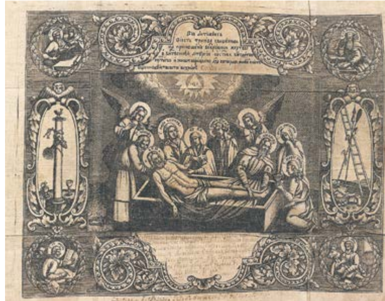
Антиминс «Положение во гроб». И. Ф. Зубов. 1754 г. («средний» антиминс, доска 1720-е гг.). Церковь святого апостола Иоанна Богослова. Холст, офорт, резец, чернила, перо. 45,5×52,5 см. Музей христианского искусства «Церковно-археологический кабинет» Московской духовной академии

— Эта ткань, по учению святителя Симеона, архиепископа Солунского († 15.09.1429), имела особое символическое значение: «Они [антиминсы] делаются не из камня, но из ткани, наипаче из льна, в знамение того, что на них священнодействуются страдания Христовы и что они образуют погребение Христово, каковыя действия происходили на земле и от земли. Ибо лен — из земли, равно как и Гроб