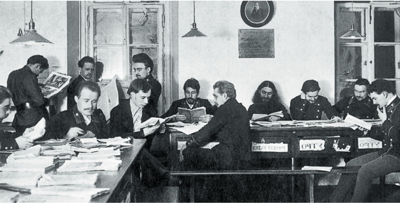
Студенты МДА за чтением свежей прессы. Фото 1912–1917 гг.

комплекс статей, посвященных авторам святоотеческой письменности IV–V веков, как в «Православной богословской энциклопедии» (о святителях Василии Великом, Григории Богослове, Григории Нисском, Дионисии Ареопагите, Дионисии Александрийском) 3 , издававшейся с 1900 по 1911 год, но так и оставшейся незавершенной, так и в журнале Московской духовной академии «Богословский вестник» 4 . Энциклопедические статьи имели определенный канон, а журнальные отражали главное стремление автора: изучая религиозные идеалы, мистические взгляды и аскетические подвиги святителей и преподобных, хотя бы немного приоткрыть тайну святости и достижения обожения.