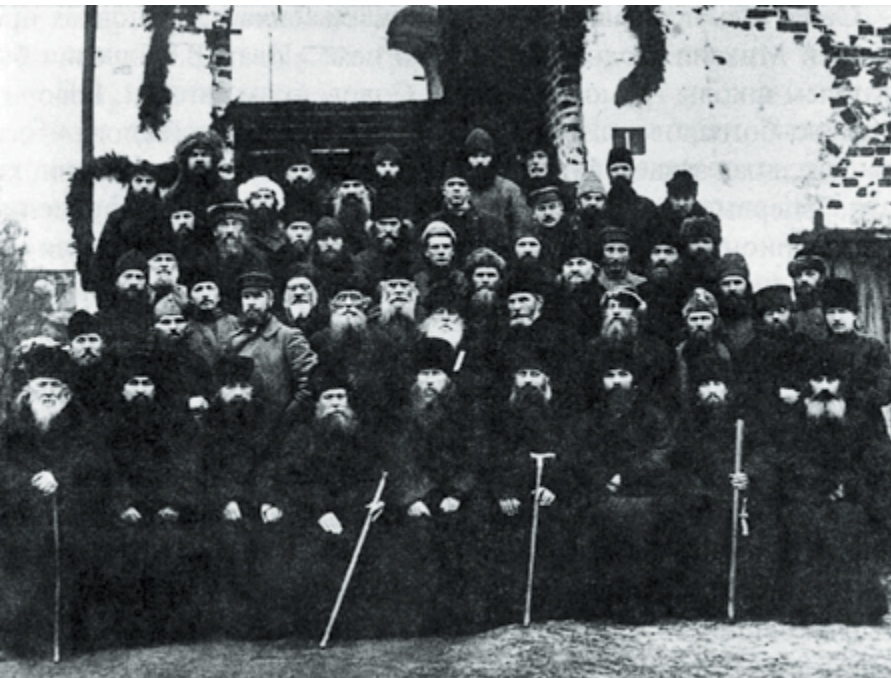
Архиереи, подписавшие «Памятную записку соловецких епископов». 1925 г.