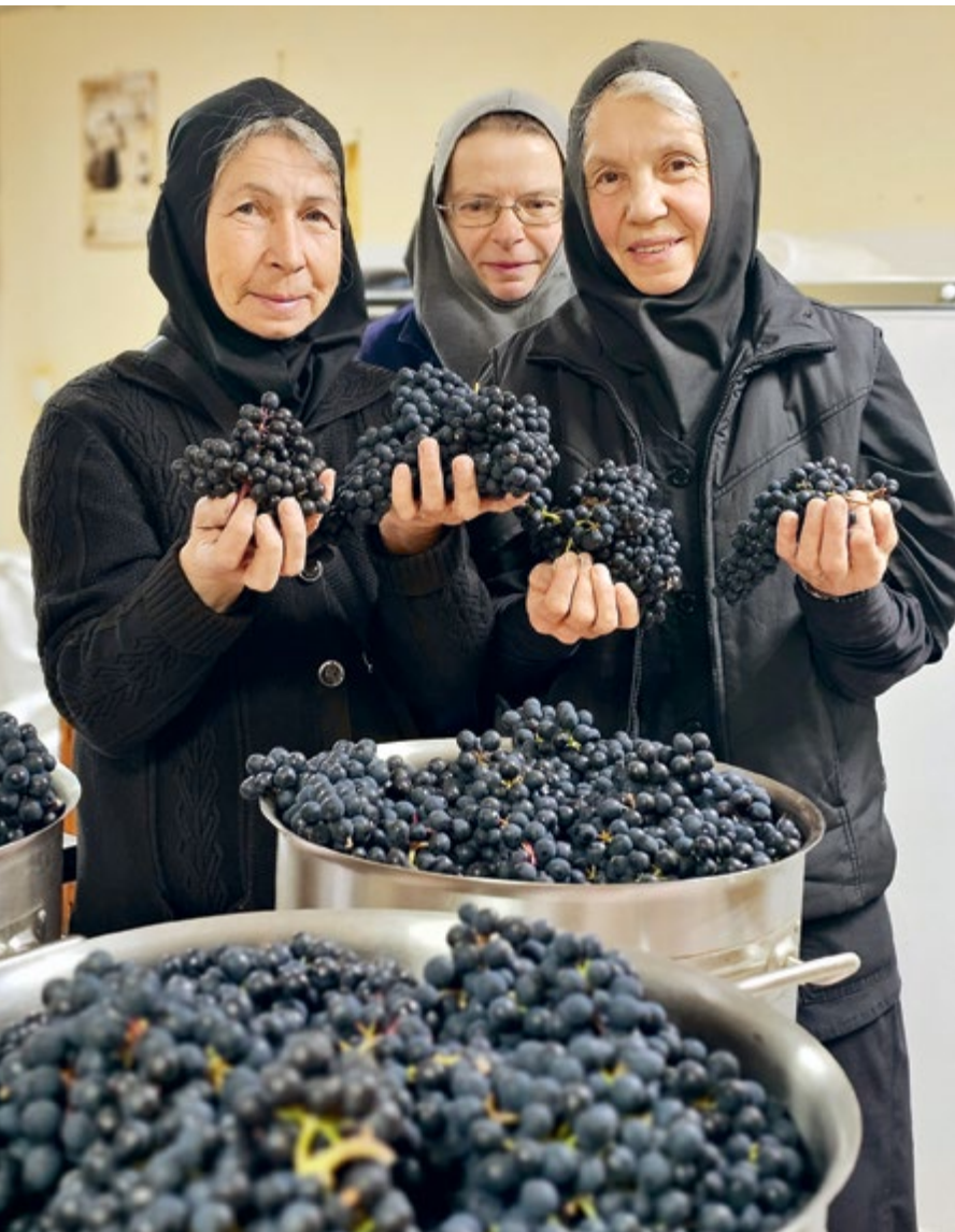
Монахини Свято-Покровского Верхотурского женского монастыря выращивают виноград...

Свердловскому и Курганскому Мелхиседеку (Лебедеву; † 2016): «Владыка, сейчас празднуется 1000-летие Крещения Руси, просите мощи, вернут». Владыка обратился с просьбой, и действительно вернули 25 мая 1989 года. До 1992 года они находились в только что возвращенном храме Всемилошного Спаса в районе Елизавет в Екатеринбургe. Это была раньше заимка Ново-Тихвинского женского монастыря.