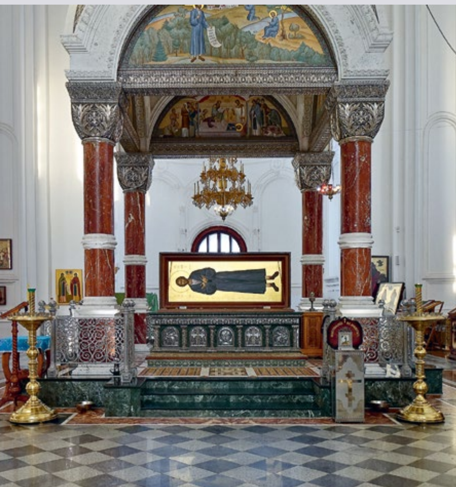
Гробница с мощами праведного Симеона

Со временем из Верхотурья в Меркушино возникла паломническая Симеонова тропа, по которой ежегодно ходят богомольцы. В маршрут включен и Симеонов камень — место на берегу Туры под елью, где праведник рыбачил и уединялся для молитвы.