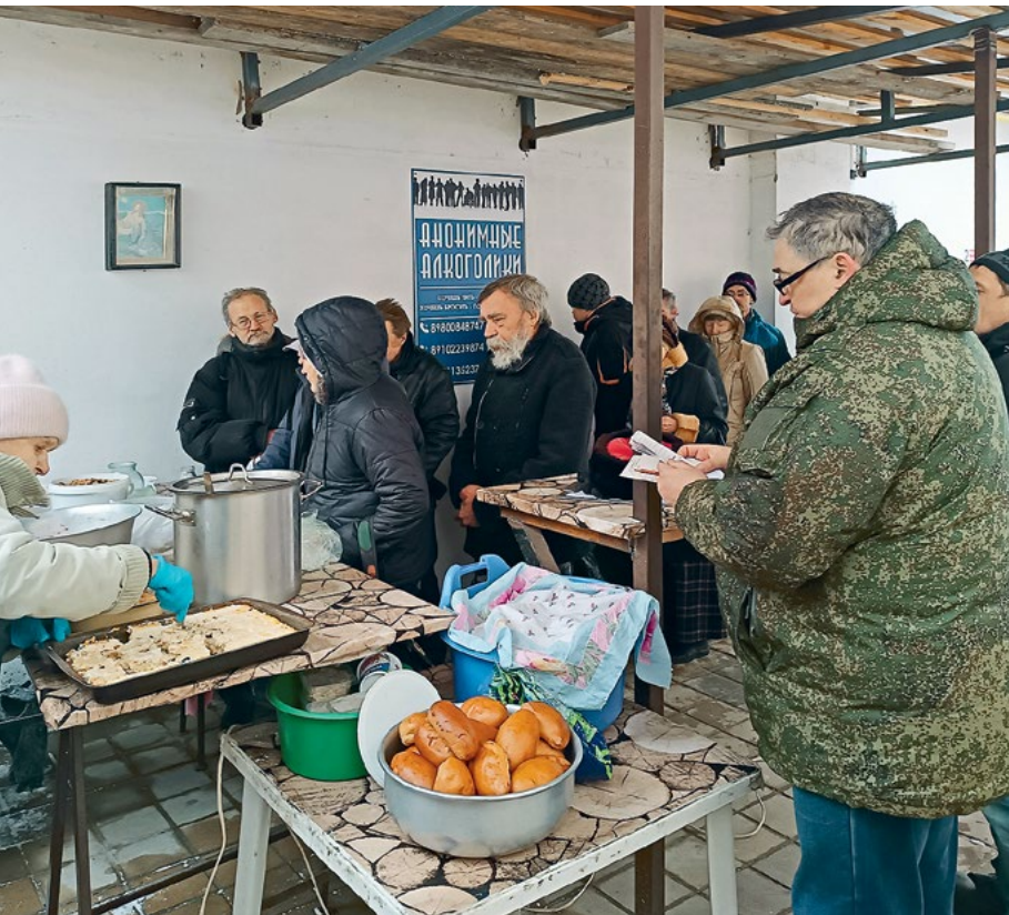
Благотворительная столовая и Гуманитарный центр в Марфо-Мариинском сестричестве милосердия. Марфо-Мариинский женский монастырь, г. Белгород