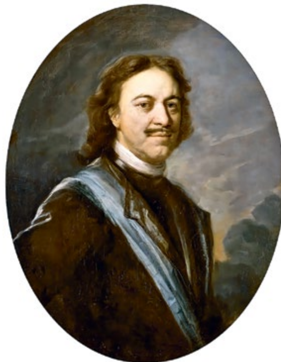
Духовный регламент, установленный вместо патриаршества Святейшим Правительствующим Синодом. 1721 г. (слева)

арх, когда Церковь имела достаточно большую власть в империи, в государстве, которое de jure считалось православным. Неслучайно после смерти Патриарха Адриана († 1700) император просто остановил процесс избрания нового Предстоятеля Церкви. Для этого он опирался на содействие понимающего его задачи иерарха — Феофана (Прокоповича, † 1736). Был организован Святейший Синод, в дальнейшем получивший наименование еще и Правительствующего, начались церковные преобразования.