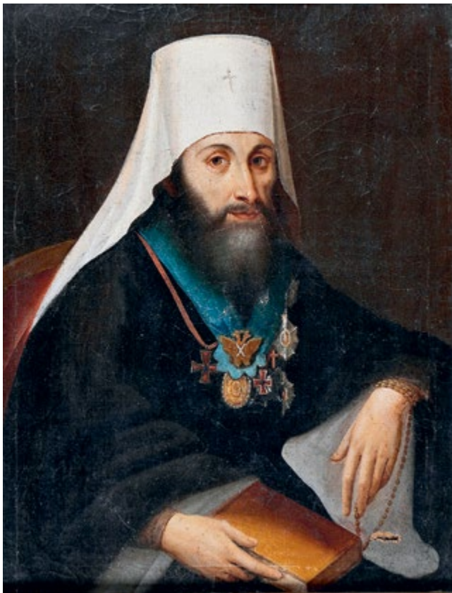
Неизвестный художник. Портрет митрополита Московского и Коломенского Филарета (Дроздова). Середина XIX в. ММДА «ЦАК» (слева)