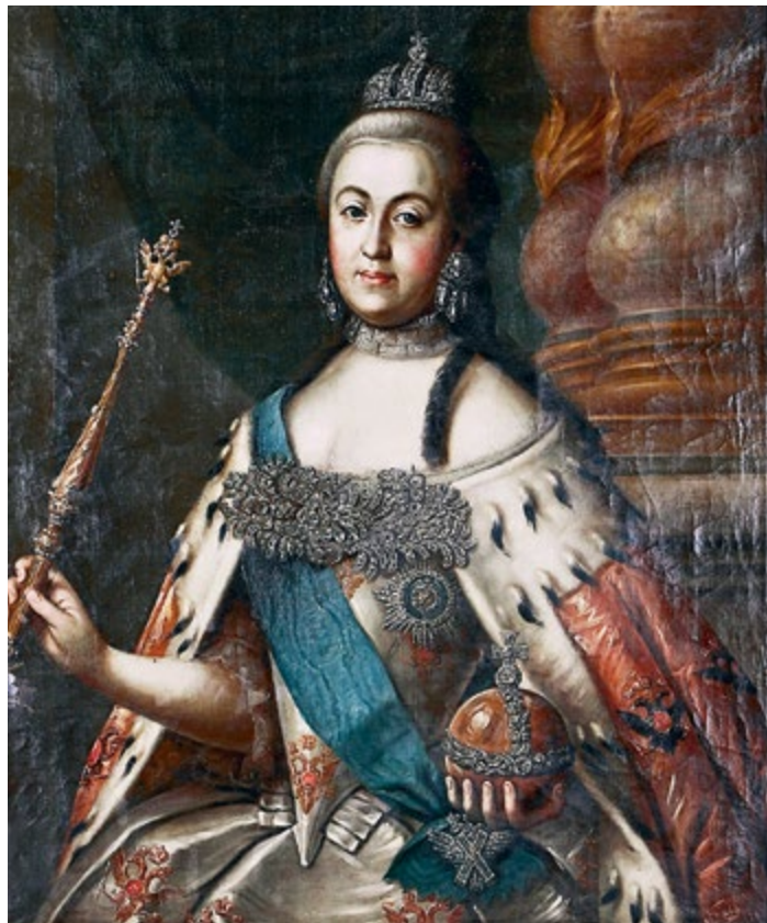
Неизвестный художник. Портрет императрицы Екатерины II. Конец XVIII – начало XIX в. ММДА «ЦАК» (справа)