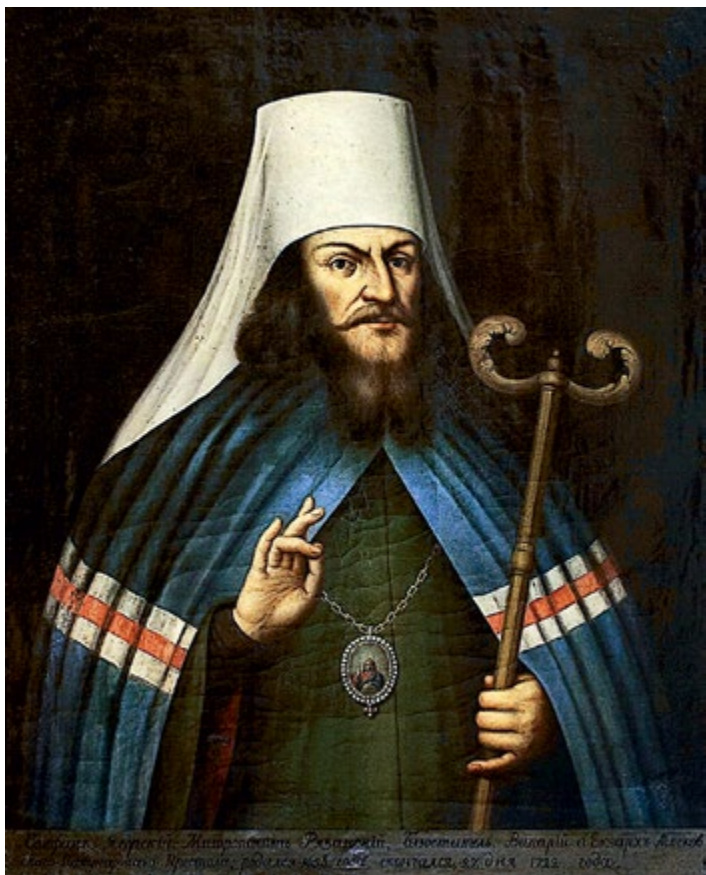
Неизвестный художник. Портрет Стефана (Яворского), митрополита Рязанского и Муромского, Местоблюстителя Патриаршего Престола (в 1701–1721 гг.) (слева)