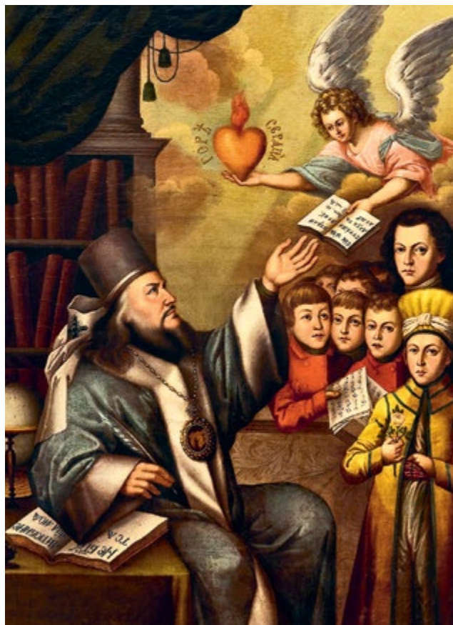
М. Платонов (?). Портрет Платона (Лёвшина), митрополита Московского и Коломенского, с учениками Вифанской семинарии. Начало XX в. ММДА «ЦАК». (справа)

Петр хотел иметь в лице церковных иерархов своих политических и идеологических союзников. Следует учесть, что царь не доверял русскому духовенству, и не случайно начиная с Петровской эпохи к управлению Церковью стали активно привлекаться иерархи из малороссийских земель.