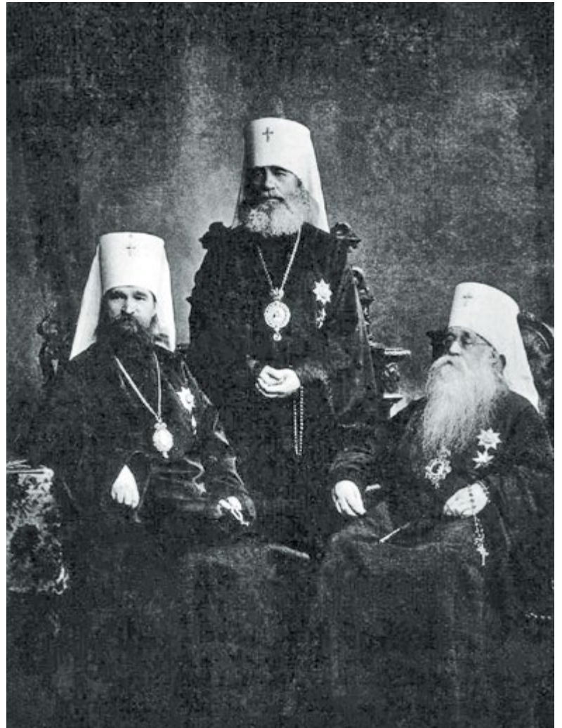
Священномученик Владимир (Богоявленский), митрополит Антоний (Вадковский) и митрополит Флавиан (Городецкий)

Синодальный период дает нам возможность лучше понять, что такое самостоятельность Церкви; насколько церковное священноначалие может и должно прислушиваться к народу Божию, то есть к верующим; насколько важно понимать состояние общества в целом, зани-