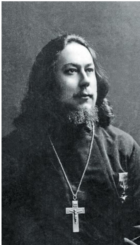
Священномученик Иоанн Кочуров (вверху)

Храм святого Михаила, г. Ситка (до 1867 г. — Ново- Архангельск), штат Аляска. Фото до 1895 г.