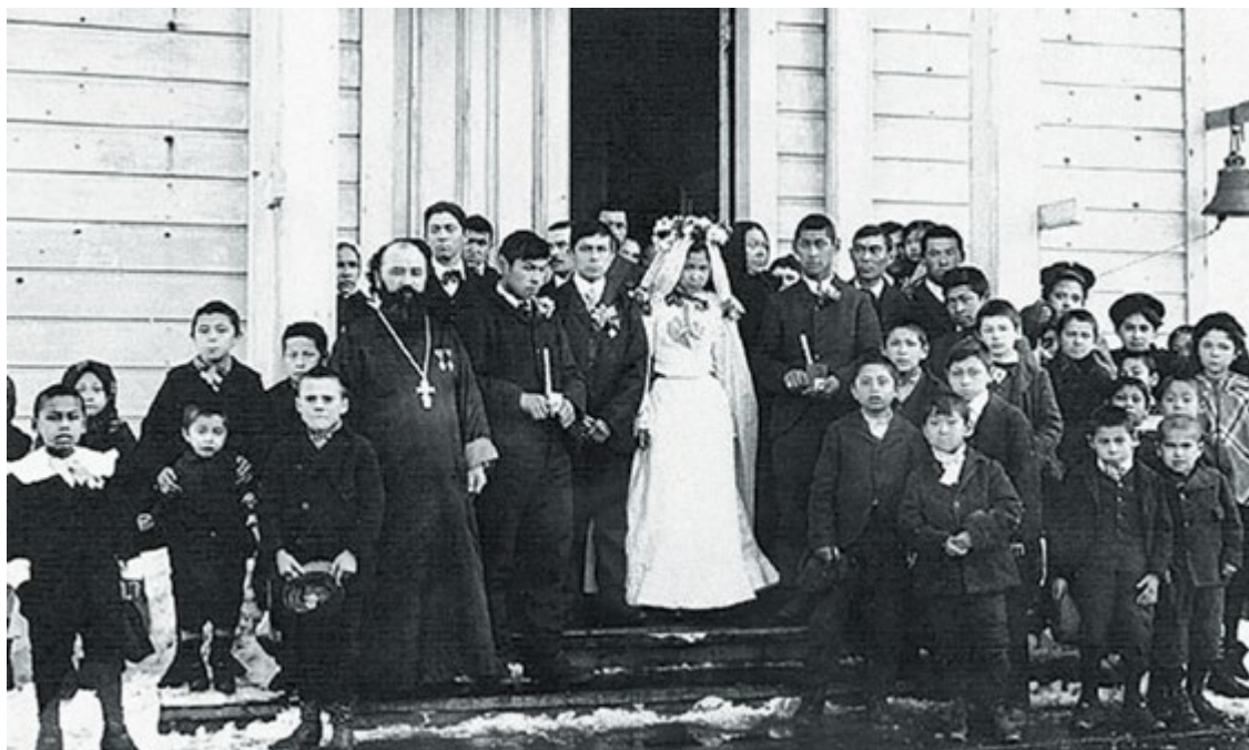
Православная свадьба на острове Святого Павла, Аляска. 1898 г.