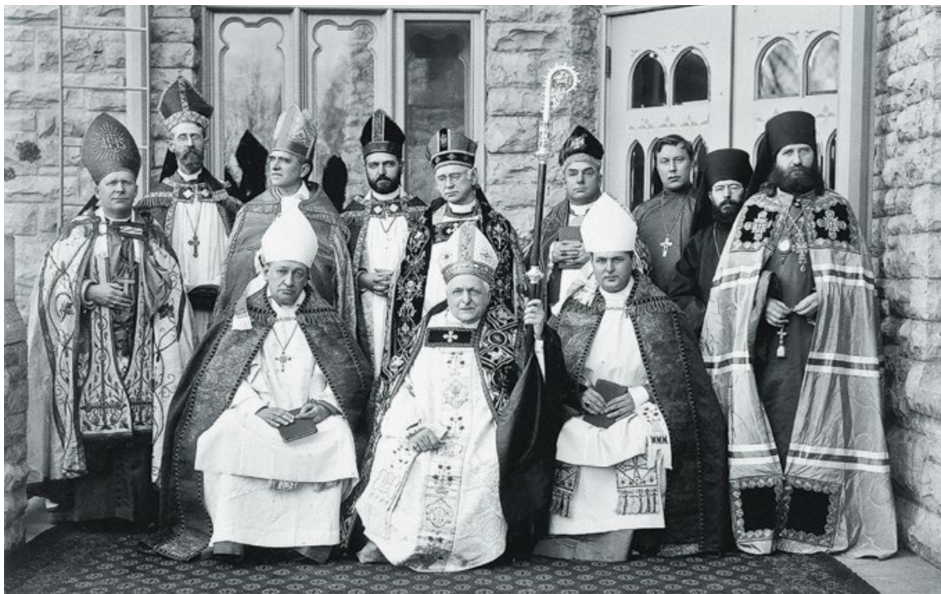
Хиротония Реджинальда Хиберы Уэллера во епископа Епископальной Церкви США в соборе святого Павла в Фон-дю-Лаке 8 ноября 1900 г. Крайний справа стоит епископ Тихон (Беллавин)

граничат с нежелательными новшествами, они могут быть признаны терпимыми.