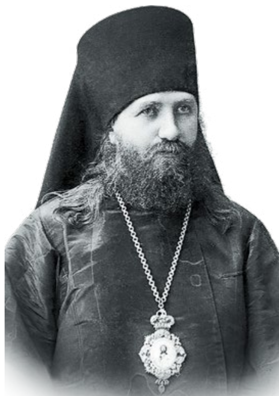
Епископ Тихон (Беллавин). 1903 г.

«Американский православный вестник», основанный в 1896 году, стал первым официальным периодическим изданием Алеутской и Аляскинской епархии. Благодаря ему православное духовенство, разбросанное по огромной территории, было в курсе всех событий епархиальной жизни. Журнал публиковал новости и уникальные статьи на богословскую, церковно-практическую тематику и путевые заметки русских православных миссионеров.