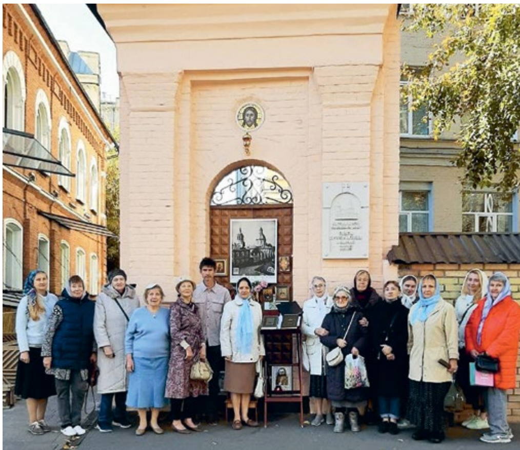
Прихожане храма Спаса Преображения

В наши дни, по прошествии столетия со дня блаженной кончины Патриарха Тихона, благочестивые потомки прихожан Спасского прихода из числа жителей Большой Спасской улицы и равнодушные москвичи, объединенные в возрождаемую Спасскую общину, около трех лет (2022–2025) молятся на регулярных уличных молебнах о возрождении Спасского храма и прихода, собираясь перед сохранившейся аркой храмовой ограды, через которую входил в Спасский храм святитель Тихон.