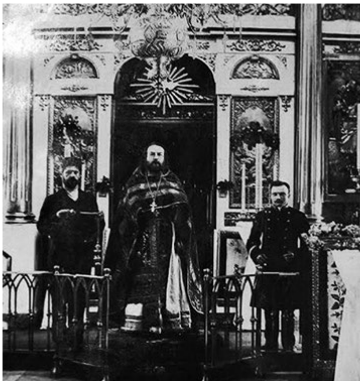
Листок с именем претендента на Патриарший Престол, вынутый в качестве жребия. Надпись: Тихон Митрополит Московский и Коломенский. Печать. Всероссийский церковный собор. 1917 год. ГАРФ. Ф. Р-3431. Оп. 1. Д. 270 (вверху)