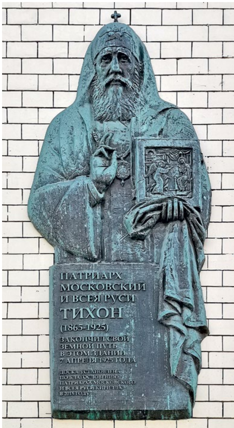
Мемориальная доска в память о святителе Тихоне, Патриархе Московском и всея России, на месте его блаженной кончины: Москва, ул. Остоженка, д. 17–19

образ Благовещения Пресвятой Богородицы в серебряном окладе.