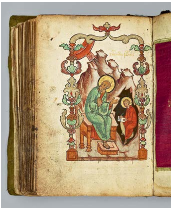
Евангелие-тетр (напрестольное) в переплете, обтянутом зеленым бархатом. Россия. XVI в. Музеи Московского Кремля

велением на покой в Соловецкий монастырь. В 1649 году он вернулся в Троице-Сергиеву лавру со своими учениками, где принял схиму, там он скончался и погребен.