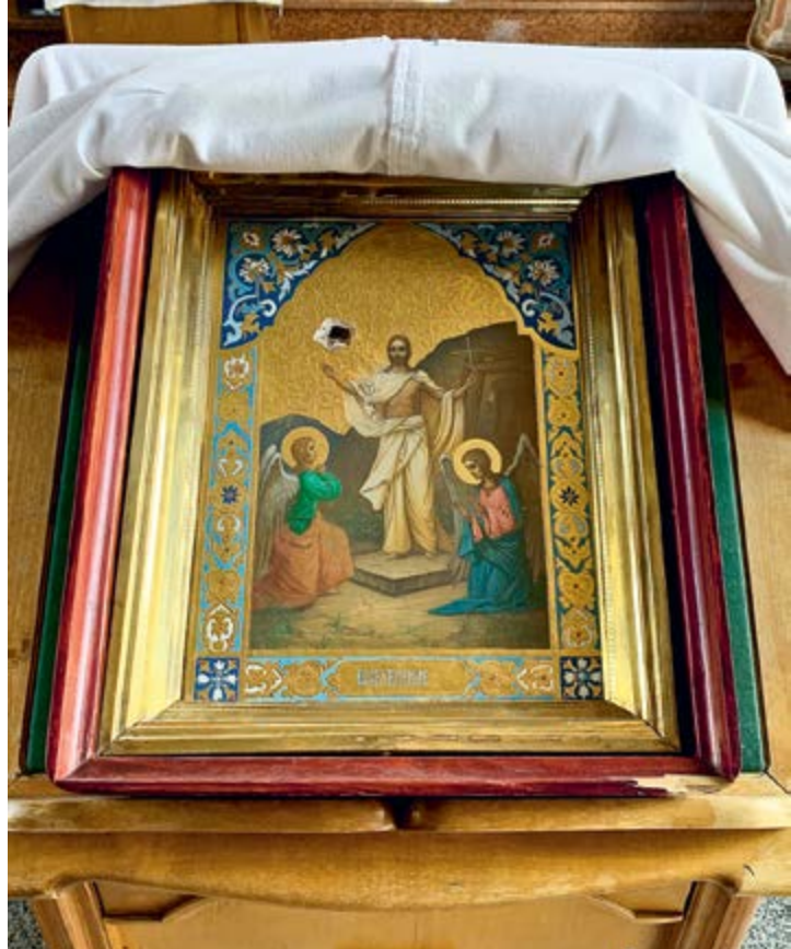
Икона, пробитая осколком при попадании в храм Всех святых (справа)

Иерусалима. И только начинался обстрел, она этим крестом, по моему благословению, крестила на все четыре стороны наш монастырь и не расставалась с ним. Кстати, этот крест мы так и не нашли.