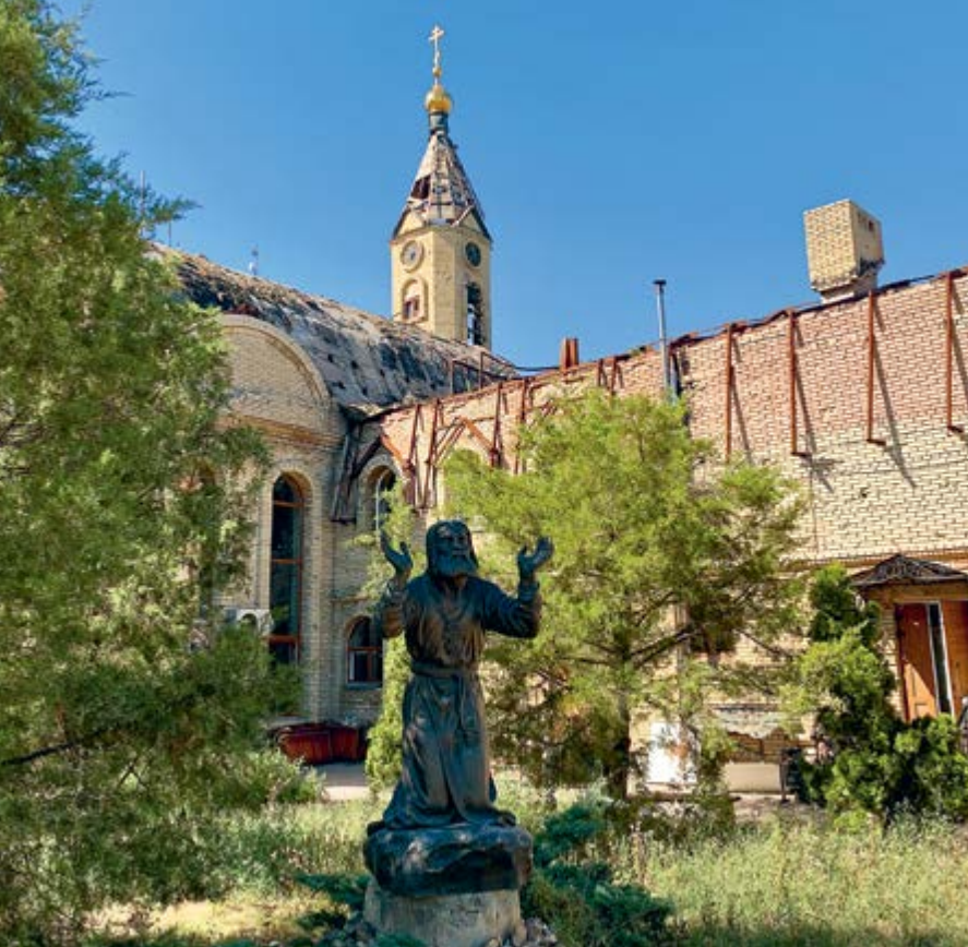
Памятник преподобному Серафиму Саровскому возле храма Всех святых, в земле Российской просиявших (слева)