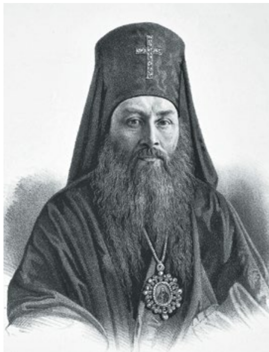
Архиепископ Херсонский и Таврический Иннокентий (Борисов).

Особое место в биографии святителя Иннокентия занимает период его управления Херсонской и Таврической епархией, на которую он был переведен в феврале 1848 года. Примечательна его забота о восстановлении древних христианских памятников в Крыму. Целью трудов владыки Иннокентия по возрождению святынь было образование на Крымском полуострове «русского Афона», проект создания которого он прописал в «Записке о восстановлении древних святых мест по горам Крымским». Он не только сам собирал исторические сведения о древних монастырях, церквях, святых подвижниках, связанных с Крымом, но и пытался привлечь к этому процессу образованное российское общество. Его заботы по налаживанию дел в Крымской епархии многократно увеличились с началом Крымской войны. Как отмечает один из биографов святителя, «нравственное участие преосвященного Иннокентия в Крымской войне России со всею почти Европою известно всякому образованному русскому человеку» 8 . Скончался святитель в Одессе в праздник Пятидесятницы 26 мая 1857 года.