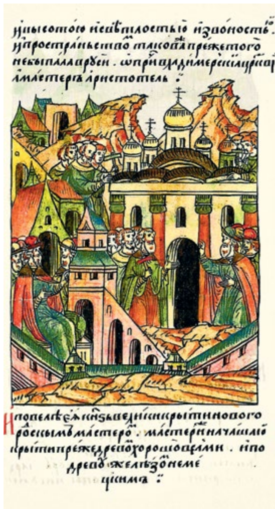
Миниатюра из Лицевого летописного свода. 1550–1570 гг. Подпись: «И высотой, и светлостью, и звонностью, и пространством, такой же прежде того не бывало на Руси, кроме Владимирской церкви; а мастер — Аристотель»

Фиораванти сделал очень большой алтарь, который занимает четвертую часть объема всего собора. Так до него никогда у нас не строили. Алтари, как правило, были заметно меньше наоса. В соборе была устроена низкая каменная алтарная преграда, по типу византийских и рус-