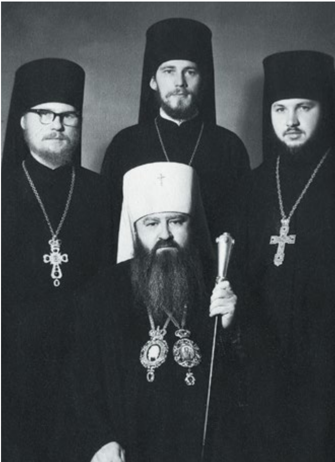
С митрополитом Никодимом (Ротовым). 1970-е гг. (слева)