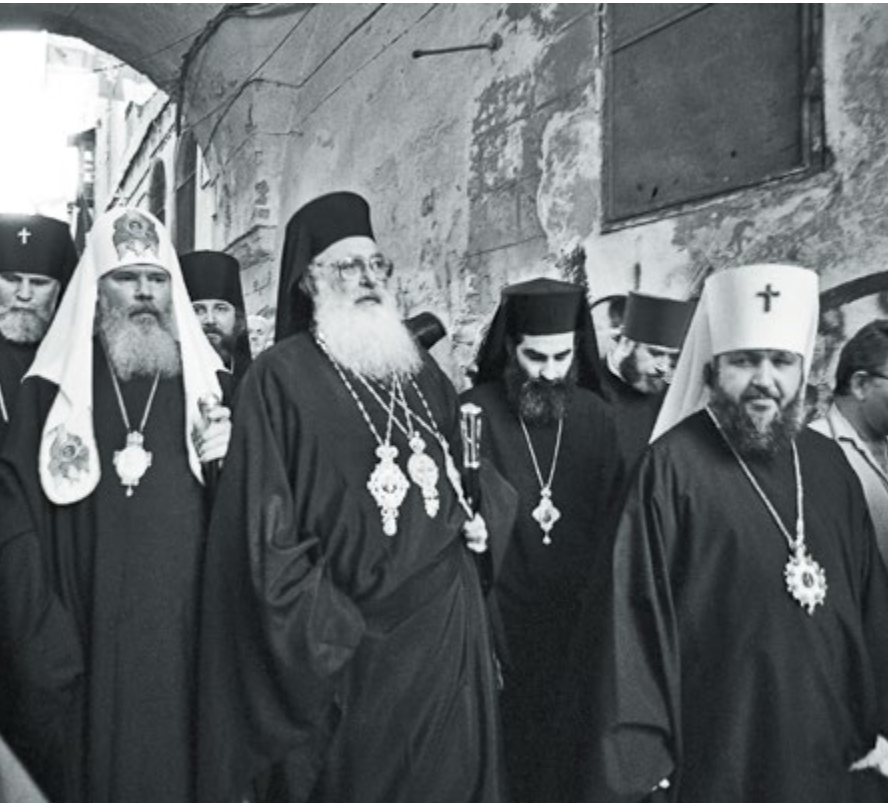
Визит на Святую Землю. 1992 г. (слева)

Архиепископ Берлинско-Германский и Великобританский Марк, митрополит Смоленский и Калининградский Кирилл и Митрополит Восточно-Американский и Нью-Йоркский Лавр. (справа)