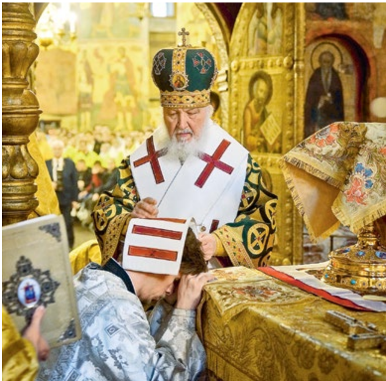
Патриаршее служение в день памяти святителя Петра, митрополита Московского. Успенский собор Кремля. 3 января 2026 г.

церковное — единомыслие, верность, молитва, взаимная поддержка.