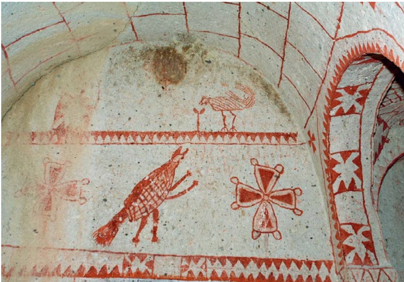
Фигуры курицы и прямоходящего жука. Около 1100 г. Северный люнет пещерной церкви святой Варвары в Музее под открытым небом Гёреме. Здесь представлены самые красочные геометрические росписи красного цвета в Каппадокии

всегда было развито светское искусство, которое в первую очередь обслуживало политический культ императора. В иконоборческих церквях доминировали изображения Креста и стены к тому же украшались растительными и животными орнаментами. Православные говорили, что враги икон превратили церкви в огороды и птичники.