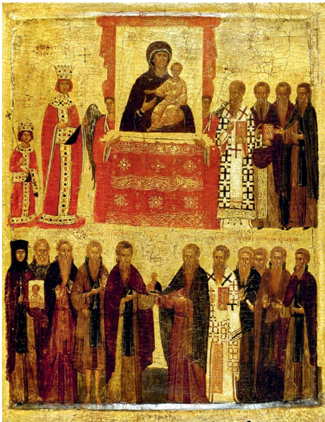
Икона «Торжество Православия». 1375–1425 гг. Византия. Из коллекции Британского музея

самим Телом и самую Кровию». Представляя евхаристические Виды как образ, иконоборцы мысленно раздваиваются между евхаристическим реализмом и символизмом. Иконопочитание утверждено на Священном Предании, которое не всегда существует в записанном виде: «Многое предано нам неписьменно, в том числе и изготовление икон; оно также распространено в Церкви со времени апостольской пропове-