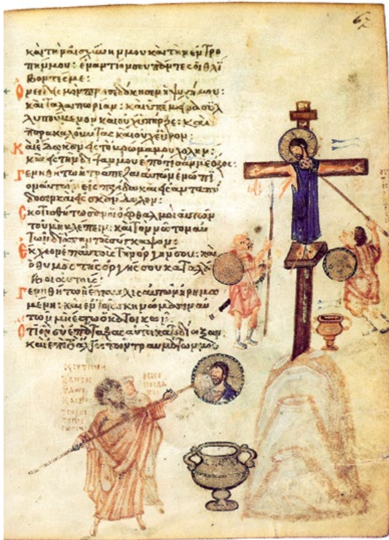
Иконоборцы Иоанн Грамматик и епископ Антоний Силейский замазывают известью икону Иисуса Христа. Середина IX в. Миниатюра из Хлудовской Псалтири. ГИМ (Греч. № 129 д. л. 62)

в 770 году Патриарха Иерусалимского Феодора. Оба документа поддерживали восстановление иконопочитания. На Соборе все три восточные Патриархата были представлены, скорее символически, двумя иеромонахами. Собор должен был заседать в Константинополе в соборе Святых Апостолов. Однако в начале первого заседания, 31 июля 786 года, в собор ворвались солдаты, верные памяти императора Константина V, и разогнали Собор. Некоторые епископы воодушевленно приветствовали солдат-иконоборцев. Пришлось усугубить меры безопасности. Ненадежные гвардейцы были выведены из столицы под предлогом военной экспедиции в Малой Азии, а на их место были введены полки из Фракии, верные иконопочитанию. А новым местом Собора был назначен вифинский город Никея, маленький, но хорошо укрепленный, где небольшими силами можно было обеспечить