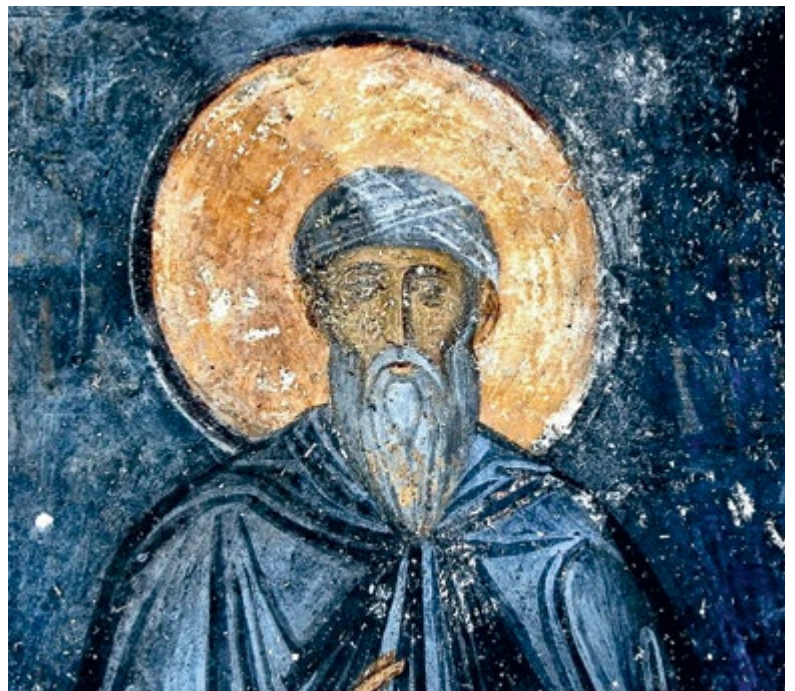
Преподобный Иоанн Дамаскин. 1208–1208 гг. Фреска церкви Успения Пресвятой Богородицы в монастыре Студеница, Сербия