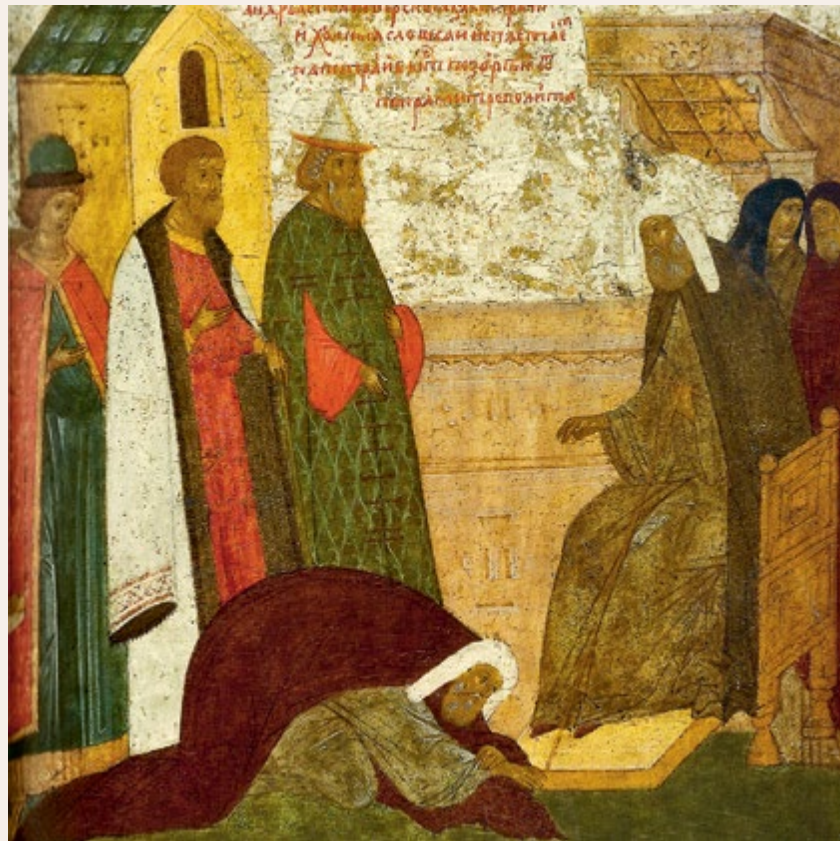
Прощение епископа Тверского Андрея, обвинявшего митрополита Петра в симонии (1311 г.) (справа)

Узы, узел, узол — чародейная навязка. Примольвление — заклинание, заговор.