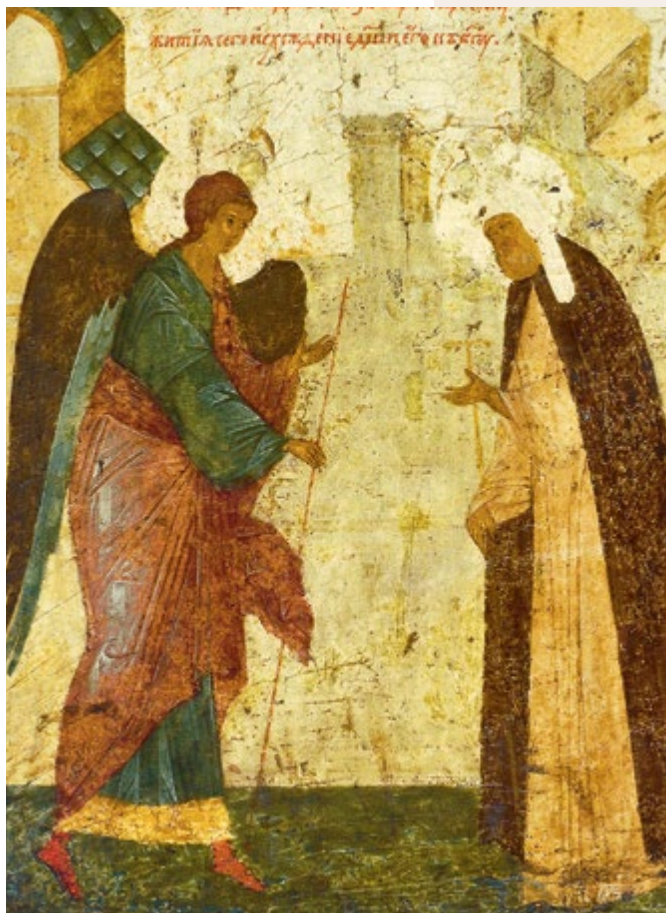
Ангел возвещает святителю Петру предстоящую кончину (слева)

Митрополит Петр завещает Протасию завершить постройку Успенского собора и передает ему деньги (справа)