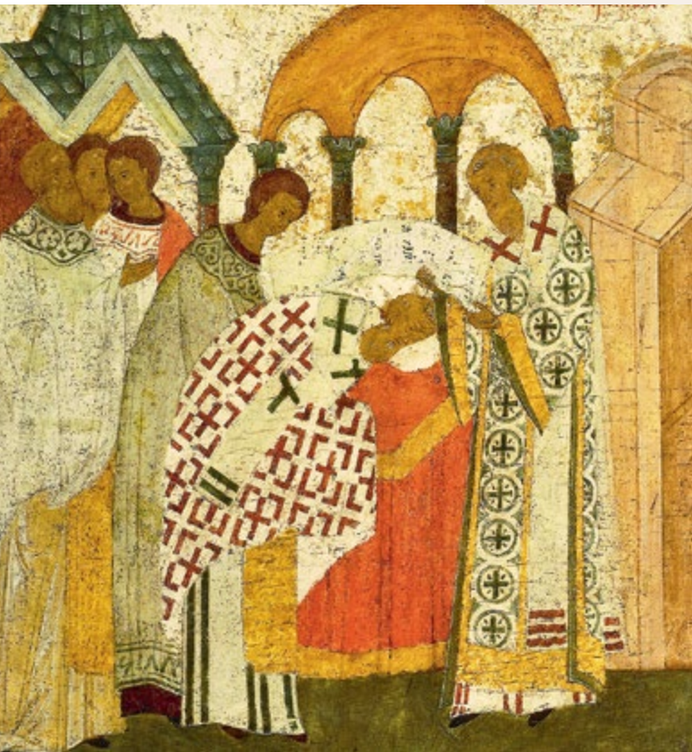
Поставление святителя Петра в митрополиты (1308 г.) (слева)