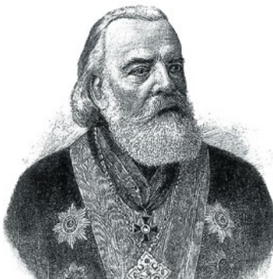
Протоиерей Иоанн Базаров. Гравюра В. К. Зейделя. Конец XIX в.

После революции 1917 года прежняя система управления зарубежными приходами ушла в прошлое. Русские храмы за рубежом лишились и официального статуса, и материальной опоры. Ситуацию осложняло и то, что правящий архиерей Петроградской епархии в годы революции и Гражданской войны не имел возможности, как он это ранее делал по должности, осуществлять реальное руководство зарубежными общинами. В условиях возникшего вакуума власти ответственность за зарубежные приходы взяло на себя Временное высшее церковное управление на Юго-Востоке России (ВВЦУ ЮВР), сформированное в мае 1919 года на Русском церковном соборе в Ставрополе. Четырнадцатого октября 1920 года ВВЦУ официально разъяснило, что все русские церкви за границей находятся в его подчинении до тех пор, пока не будет установлена связь со Святейшим Патриархом 3 . На следующий день архиепископ Евлогий (Георгиевский) был назначен управляющим русскими заграничными церквями. Девятнадцатого ноября 1920 года группа архиереев во главе с митрополитом Антонием (Храповицким) на борту парохода «Владимир», прибывшего из Крыма в Константинополь, приняла решение о продолжении деятельности ВВЦУ за границей. В указах, принятых Временным