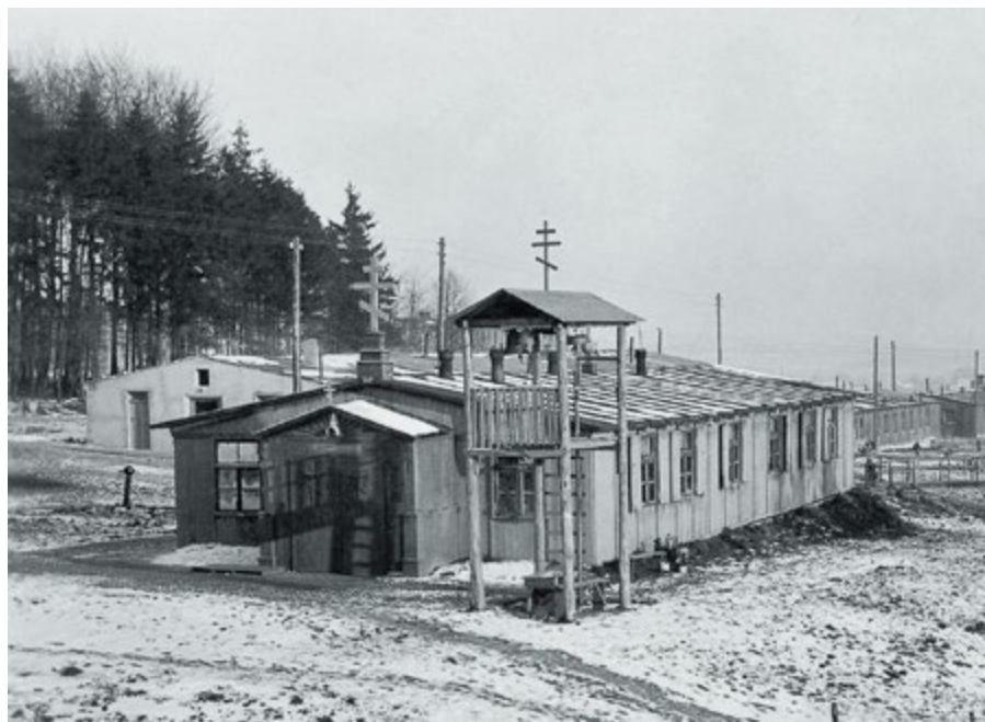
Благовещенская церковь в лагере перемещенных лиц Мёнхегоф (Кассель). Вторая половина 1940-х гг.

С началом Второй мировой войны, а тем более Великой Отечественной войны, административное положение Германской епархии РПЦЗ осложнилось. В 1942 году она была преобразована в Средне-Европейский митрополичий округ под руководством митрополита Берлинского и Германского Серафима (Ляде), включивший приходы не только в Германии, но и в оккупированных нацистами странах — Бельгии, Словакии, Люксембурге и Протекторате Богемии и Моравии (Чехия). Церкви было запрещено оказывать помощь советским