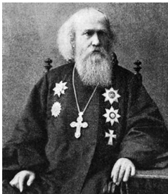
Священник Иоанн Янышев