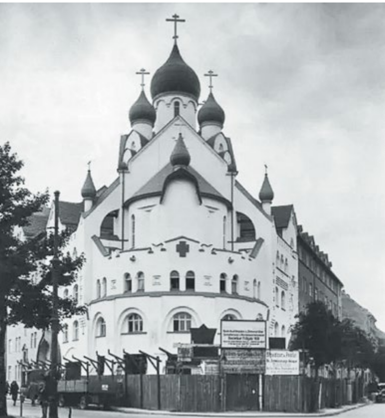
Кафедральный собор Воскресения Христова на Гогенцоллерндамм. 1932 г. (слева)