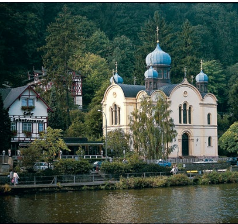
Храм святой мученицы царицы Александры в Бад-Эмсе. Современный вид (слева)