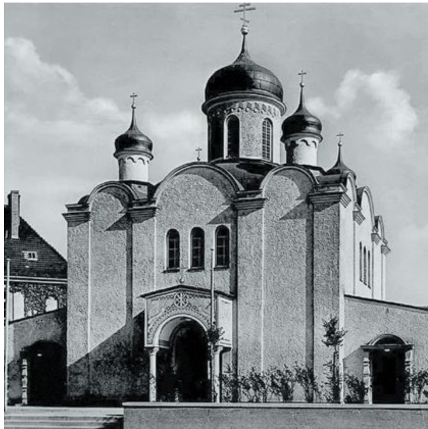
Воскресенский собор. 1974 г. (справа)

началось 1 апреля 1927 года, а 4 ноября 1928 года состоялось его торжественное освящение. Тогда же Архиерейский Синод РПЦЗ присвоил ему статус кафедрального собора Германской епархии. История этого уникального храма неразрывно связана с экономическими потрясениями той эпохи. Затраты на строительство превысили запланированный бюджет, и епархии пришлось взять ипотечный заем под залог здания. Наступивший в 1929 году мировой экономический кризис нанес удар по финансовым планам общины: долг погасить не удалось, и здание было продано на аукционе. В течение нескольких последующих лет прихожане были вынуждены арендовать свой собственный собор у нового владельца. К 1935 году здание было окончательно перестроено под гражданские нужды и утратило внешние черты православного храма. Службы в нем продолжались до 1938 года.