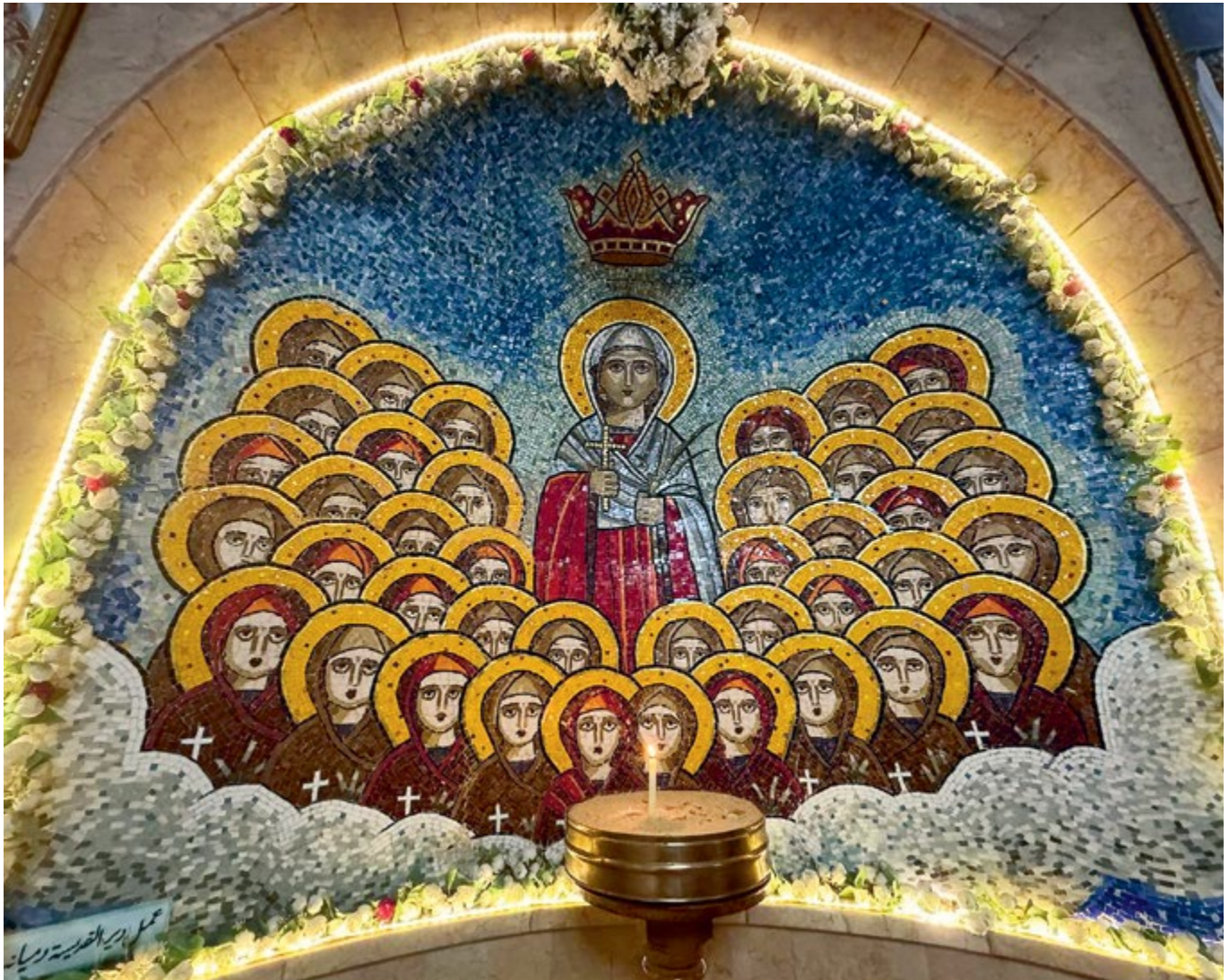
Мозаика с изображением мученицы Дамианы и сорока дев, с нею пострадавших

Патапий был епископом Кифта — города в Верхнем Египте. Он родился в Арманте в христианской семье и с детства был воспитан в вере. Житие упоминает и Андрея, сына сестры его матери. Патапий и Андрей росли вместе, читали Священное Писание и духовные книги, приучали себя к строгому воздержанию. По преданию, они постились по два дня подряд, а когда принимали пищу, довольствовались хлебом и солью.