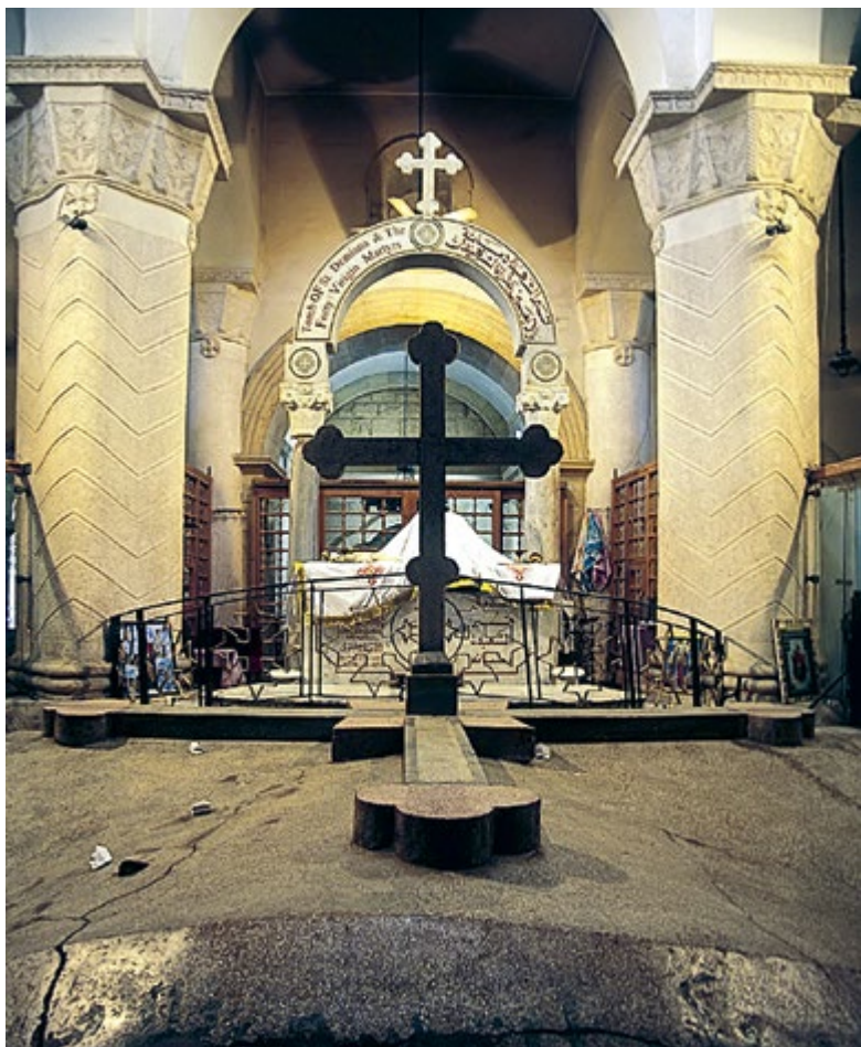
Гробница с мощами мученицы Дамианы и сорока дев

Посланец убеждал девушку поклониться богам, почитаемым в Римской империи, и готов был взамен исполнить любое ее желание. Но Дамиана отвергла это предложение. Дерево и камни, которым язычники поклоняются как богам, она назвала обиталищами бесов. Она открыто исповедала свою веру в Отца, и Сына, и Святого Духа — истинного Бога, вечного Творца всеведущего и всеведущего.