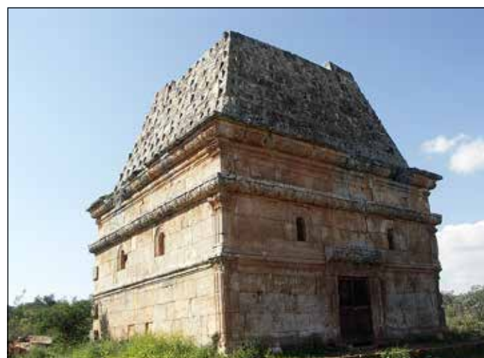
Гробница в «мертвом городе» Капроперия». VI в.