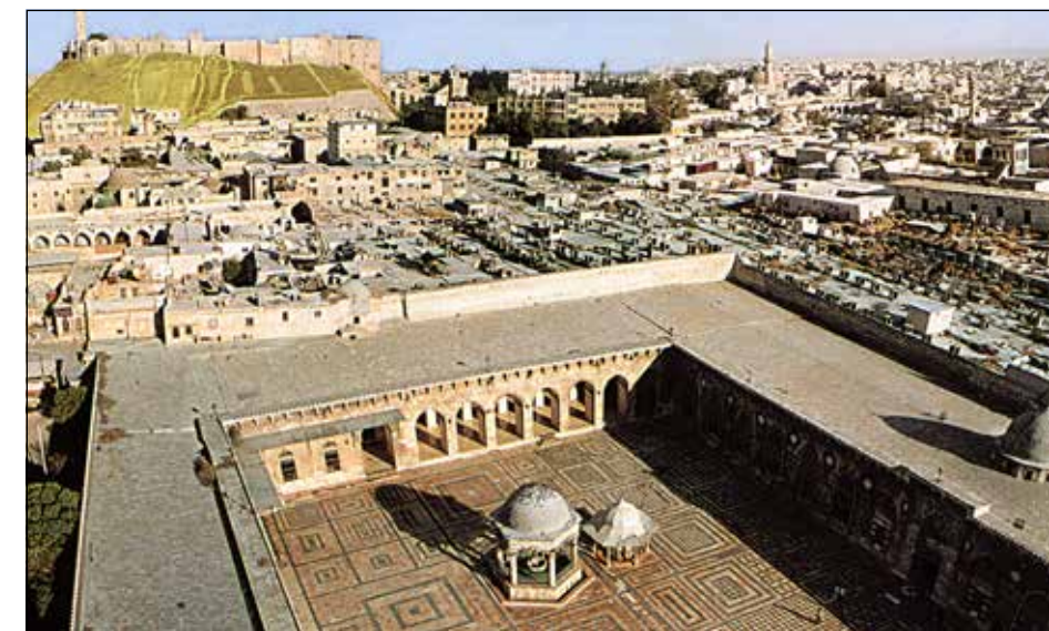
Большая мечеть Омейядов в Алеппо

После опустошительного похода Тамерлана 1400 года христиане, ушедшие из центра города, основали близ его северо-западной стены новый район Дждейда, который ныне удерживается правительственными войсками. Именно здесь среди узких улиц сохранились православный Успенский храм (XV век, перестроен в 1850–1852 годы), сиро-католическая церковь Святой Асси (1500 год, колокольня 1881 года, разрушена в 2012 году), мелькитский собор Богоматери (1849), маронитская церковь Пророка Илии с двумя колокольнями западного фасада (1873), сиро-яковитский собор Святого Ефрема (1926), многочисленные школы и другие здания, принадлежащие христианам. В соседнем районе, ближе к железнодорожному вокзалу, — римско-католический собор Святого Франциска Ассизского (1937).