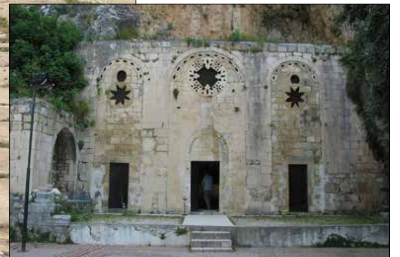
Пещерная церковь Святого Петра близ Антиохии. IV-V века. Фасад XII в.

В 1516 Антиохия была завоевана турками. В 1918 вошла в состав французского протектората, а в 1938 году в составе Республики Хатай вошла в состав Турции.