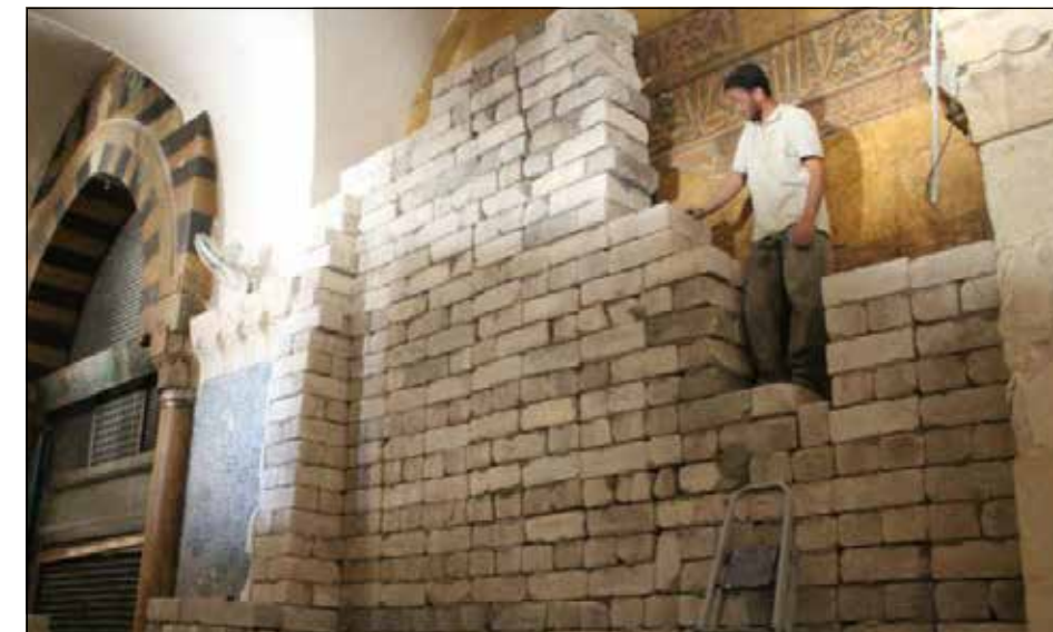
Гробница пророка Закарии в Большой мечети в Алеппо. Противовандальные меры 2013 г.