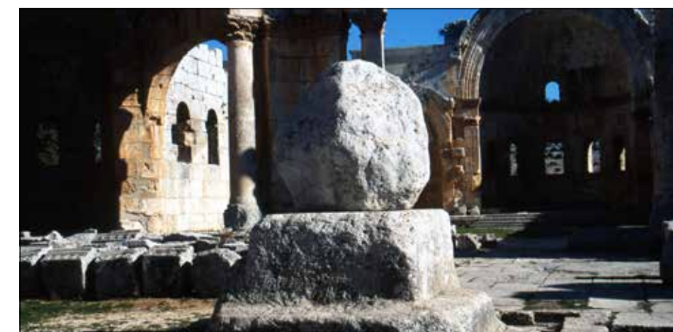
Нижняя часть столпа Святого Симеона Столпника Старшего