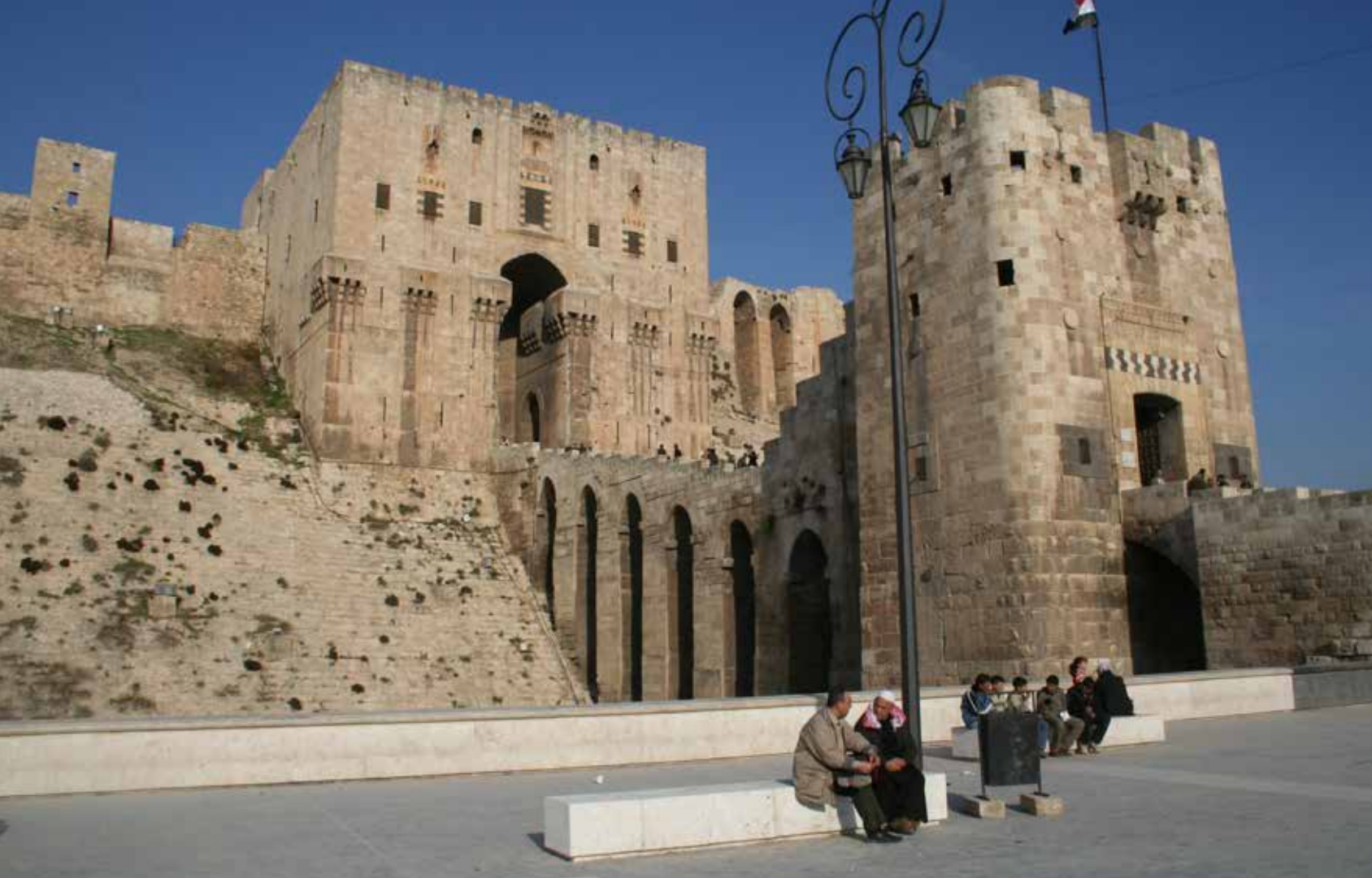
Цитадель в Алеппо»