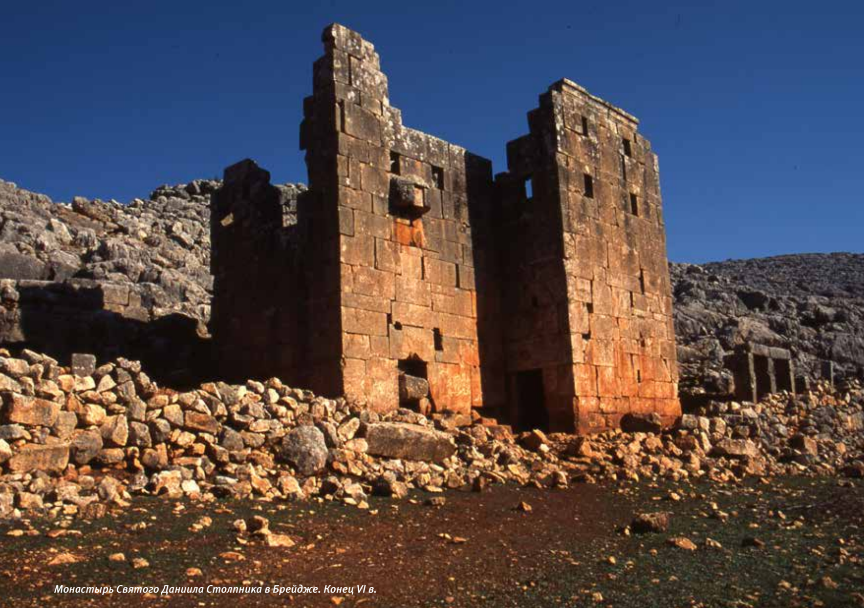
Монастырь Святого Даниила Столпника в Брейдже. Конец VI в.