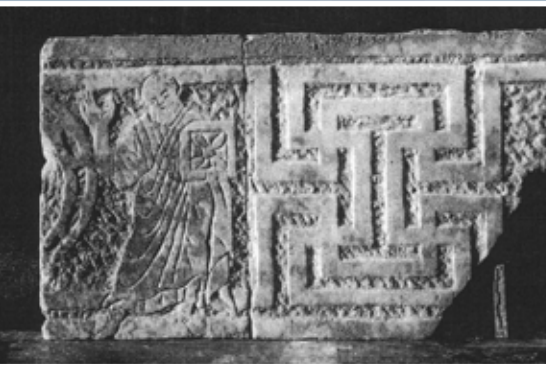
Рельеф из церкви Святой Феклы в Селевкии Пиерии. Между 474 и 491 гг.