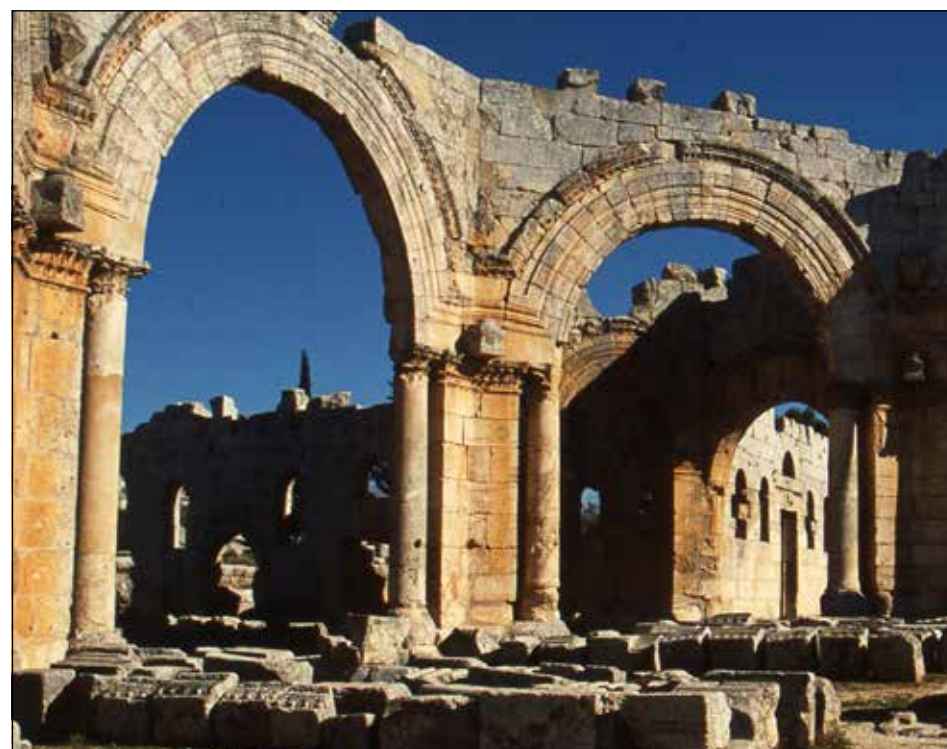
Центральная часть монастыря Святого Симеона Столпника. 480-е годы