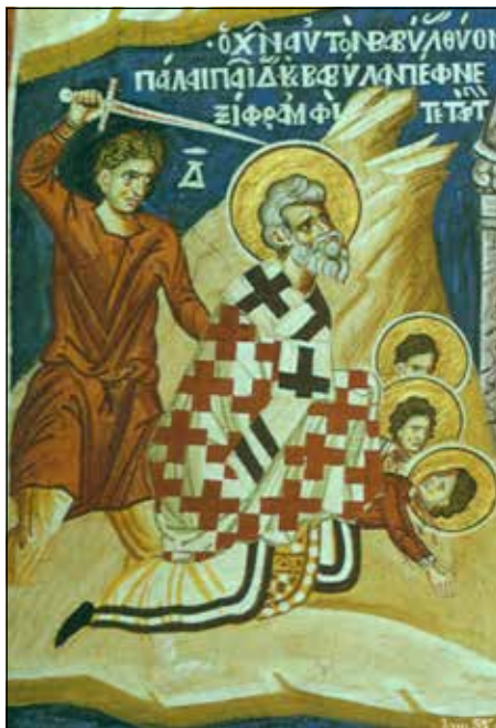
Мученичество святого епископа Вавилы. Роспись церкви монастыря Ватопед на Афоне

Один из важнейших городов для каждого христианина на Ближнем Востоке — Антакья (древняя Антиохия), город на юге Турции. Город был основан в 300 году до н.э. царем Селевком Никатором. Из-за своего выгодного географического положения в 20 км от Средиземного моря он стал столицей государства Селевкидов, а после 64 года до н.э. — резиденцией наместника римской провинции Сирия. До захвата города в 540 году персидскими войсками это был третий по величине и значению город Римской империи (после Рима и Александрии). Не случайно, что именно Антиохия стала важнейшим церковным центром на Ближнем Востоке. Рассеявшиеся от гонения, бывшего после Стефана (Деян. 11, 19), в 30-е годы сюда попали многие апостолы и их ученики. Именно здесь впервые последователи Христа были названы христианами (Деян. 11, 26). Около семи лет здесь проповедовал апостол Петр. Затем около 40 лет