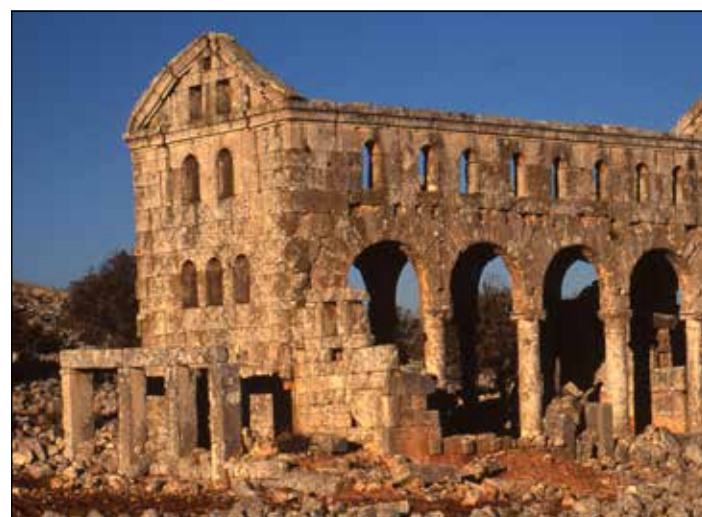
Христианская базилика IV-V вв. в Хараб-ШамсеКита