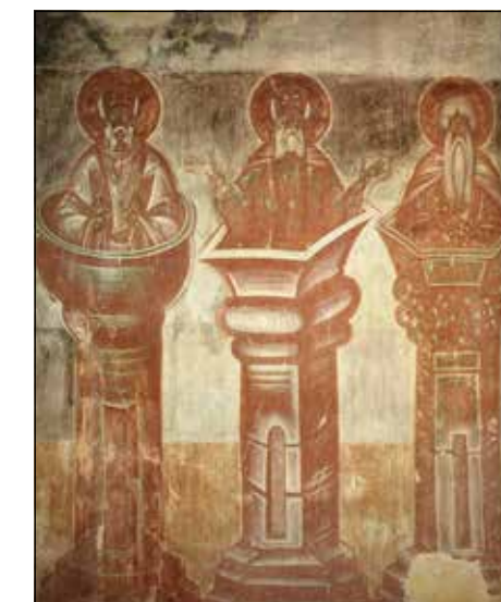
Святые столпники. Фрагмент фрески в церкви Спаса на Ильине в Великом Новгороде. Мастер Феофан Грек. 1378 г.

Север Сирии давно стал мультинациональным и многоконфессиональным. Кроме основного мусульманского арабского населения (более 70% жителей) здесь живут армяне (в Алеппо), курды, черкесы (к северу и северо-востоку от Алеппо) и многие другие национальности, исповедующие разные религии. Но сложившееся равновесие было нарушено гражданской войной и вторжением боевиков ИГ, подступивших к Алеппо. Еще в 2012 году атаке подверглись резиденции мелькитского и маронитского архиепископов в Алеппо и сам монастырь Святого Симеона. Боевики захватившими северо-восточную часть города, однако западная часть находилась под контролем правительственных войск. В апреле 2015 года был наполовину разрушен армянский кафедральный собор Сорока мучеников, заложенный еще в XV веке. В настоящее время правительственными силами установлен контроль над южной частью города, идут бои за северо-восточную часть Алеппо.