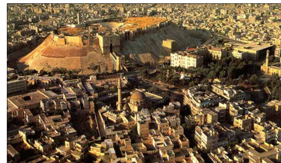
Центр города Алеппо