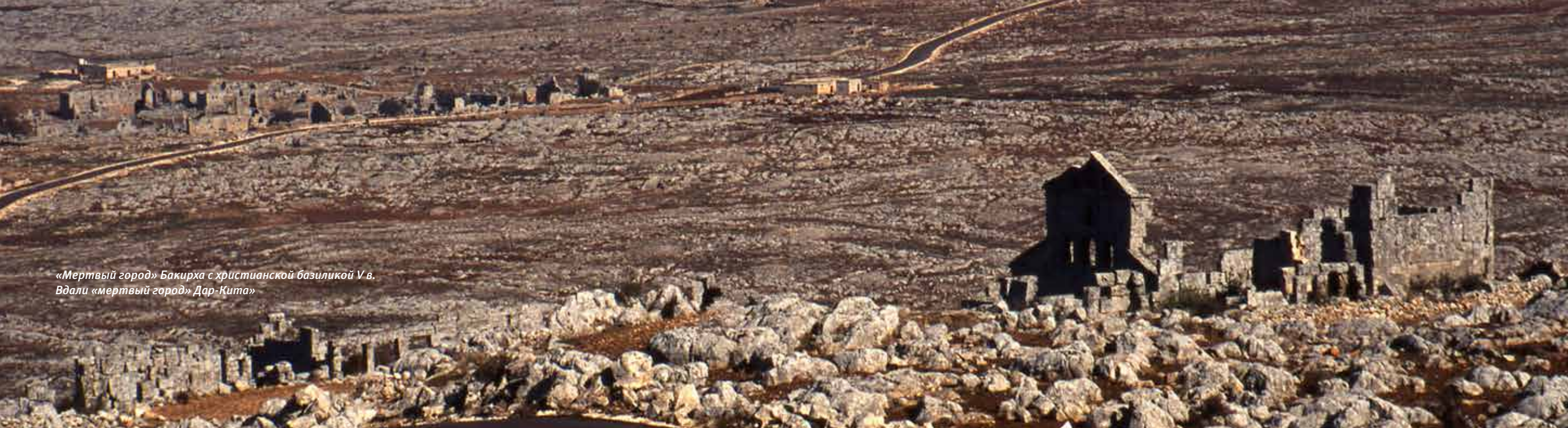
«Мертвый город» Бакирха с христианской базиликой V в. Вдали «мертвый город» Дар-Кита»